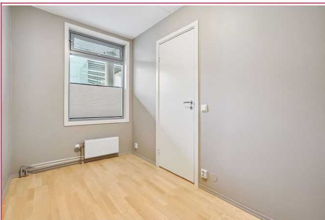
Rolig og lyst soverom med god plass til seng og oppbevaring.