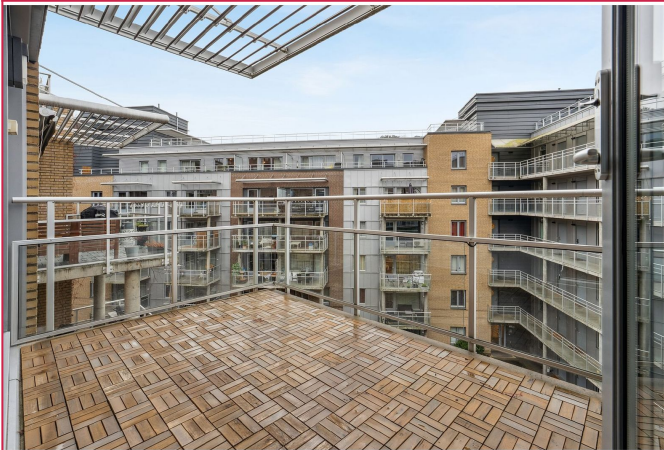
Solrik balkong på 9 kvm – perfekt for morgenkaffen eller sommerens sene kvelder.