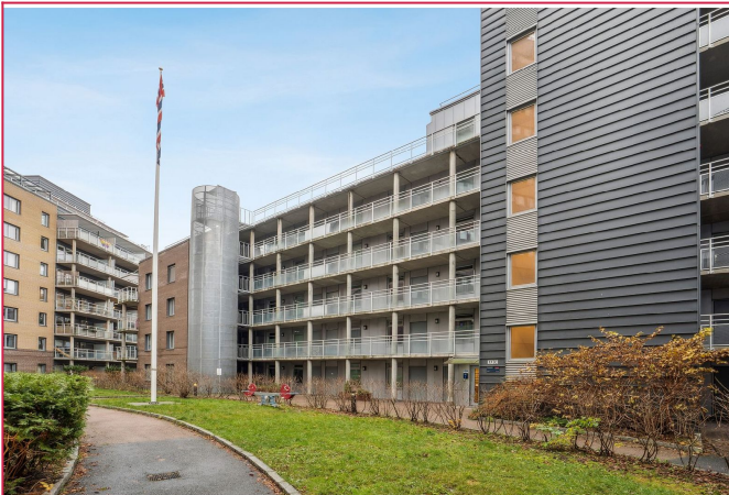
Attraktiv beliggenhet – midt mellom Grünerløkka og Tøyen, nær både parker og sentrum.