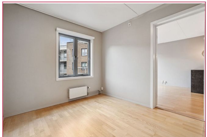
Romslig hovedsoverom med store vinduer og hyggelig atmosfære.