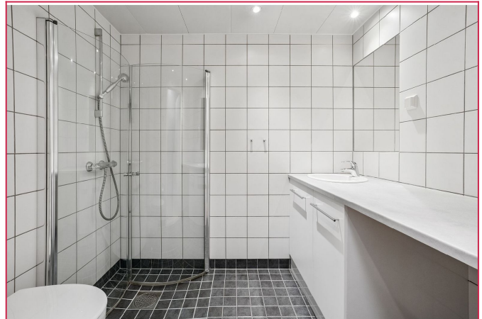
Moderne og lyst bad med praktisk løsning.