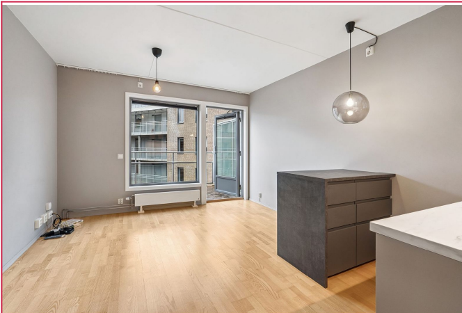
Romslig stue – åpner mot balkong og fylles med naturlig lys gjennom store vinduer.