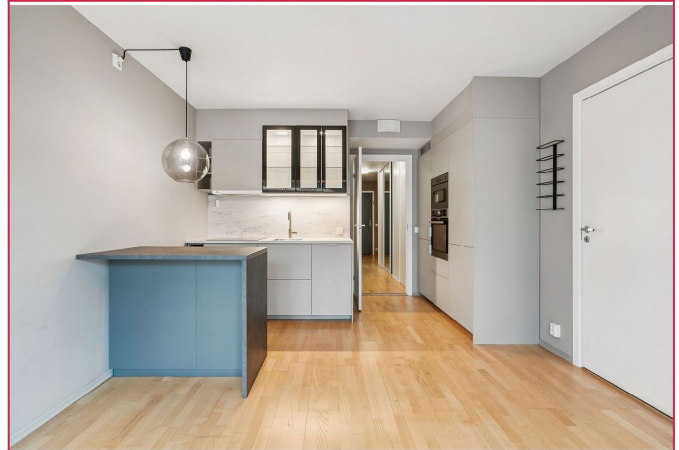
Nytt kjøkken fra 2024 – moderne og funksjonelt med god plass til matlaging.