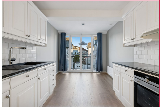
Kjøkken med plass til spisegruppe