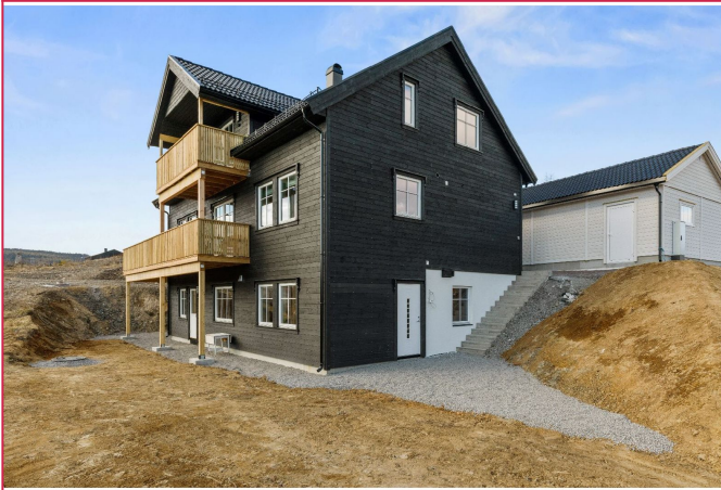
Fasade og uteplass (bildet er fra 2020)