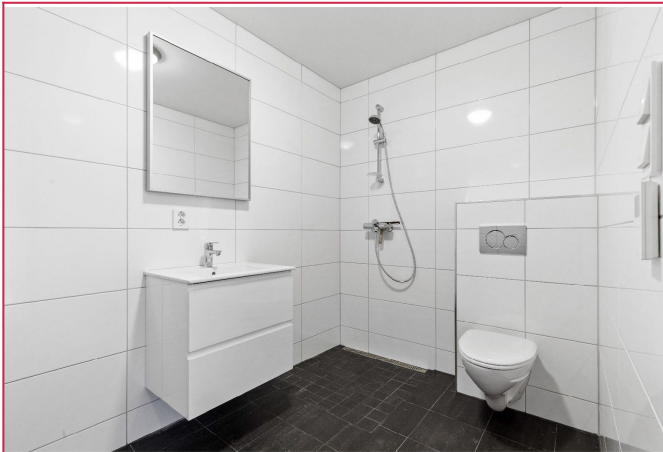
Pent flislagt bad med dusj og opplegg til vaskesøyle