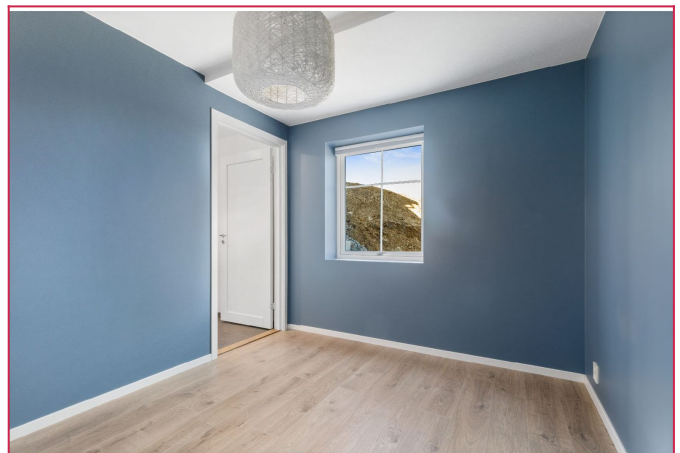
Soverom med bod