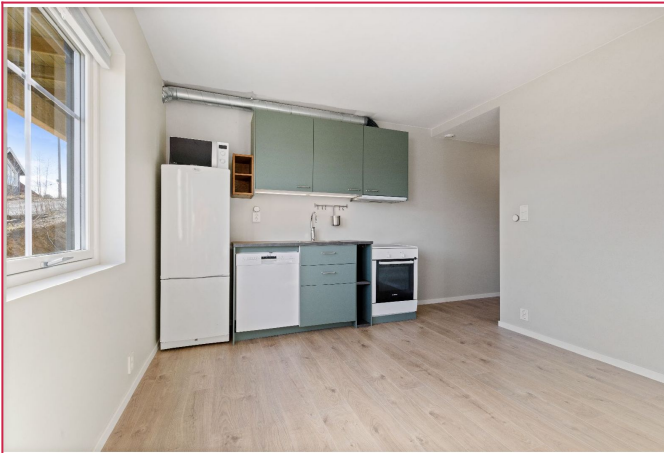
Åpen kjøkken med alle hvitevarer