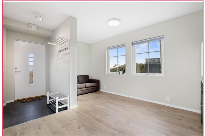
Åpen løsning fra gang mot kjøkken og stuekrok