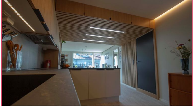
Sydvendt balkong og flott utsyn.