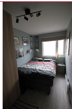
Soverommet har praktisk garderobeskap med god oppbevaringsplass.