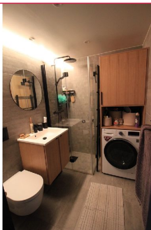
Baderommet har to ulike lysinnstillinger som gir rommet en eksklusiv og luksuriøs atmosfære.