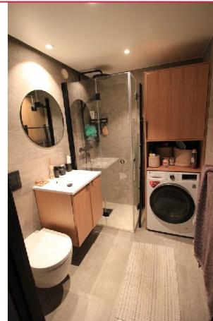
Stort og innbydende bad med god plass til komfort og velvære.