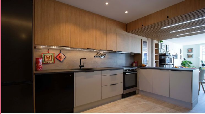
Leiligheten leies ut møblert i henhold til inventarliste.