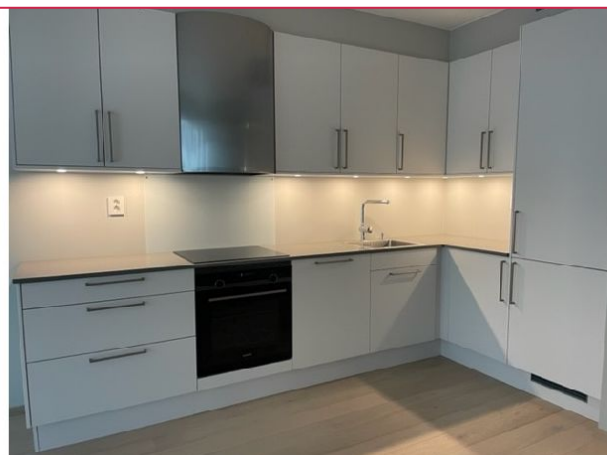
Kjøkken med itegrerte hvitevarer