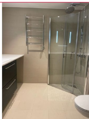
Flislagt bad med dusj og vaskemaskini