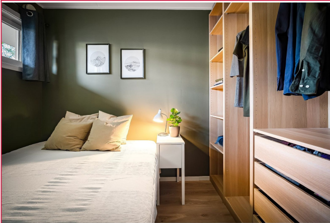
Hyggelig soverom med plass til dobbeltseng.