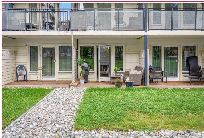
Fra stuen er det utgang til markterasse på 8,5 kvm.