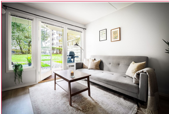
Romslig og lys stue med god plass til sofa.