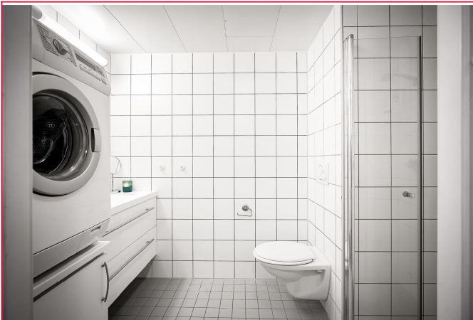
Pent flislagt bad med opplegg for vaskemaskin