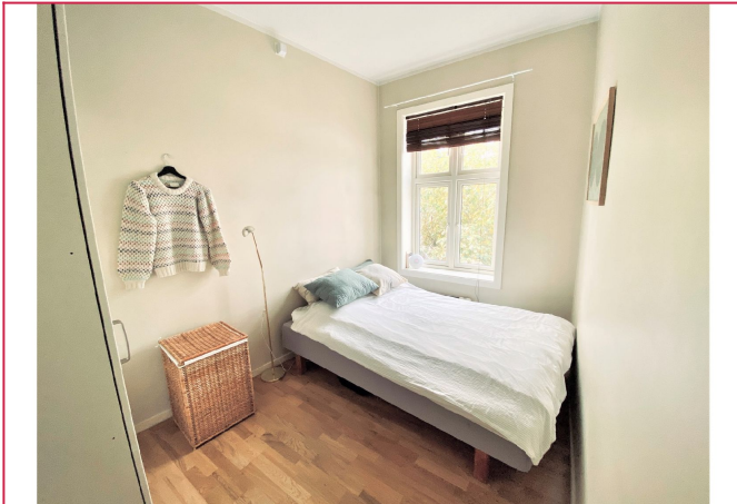
Romslig soverom vendt mot stille bakgård.