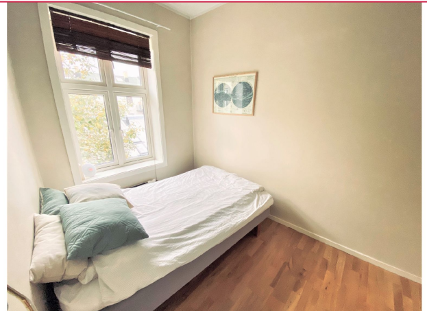
God plass til seng og garderobe.