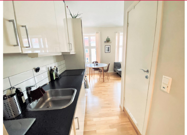
Moderne kjøkken med integrerte hvitevarer.