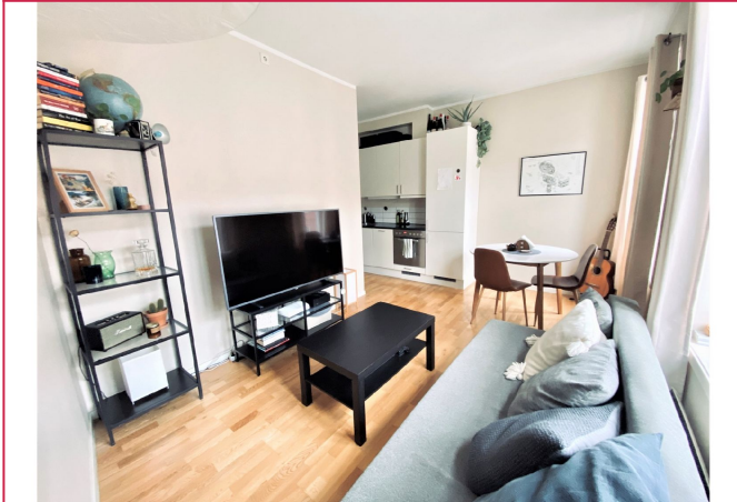
Store vindusflater gir godt lysinnslipp til stuen.