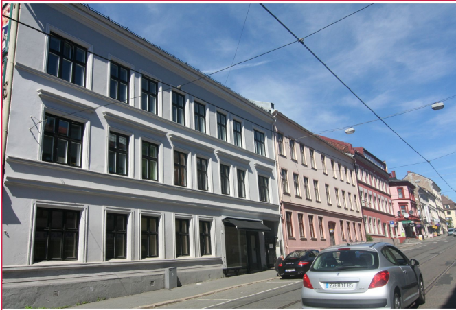
Fasade. Sentral beliggenhet på Torshov.