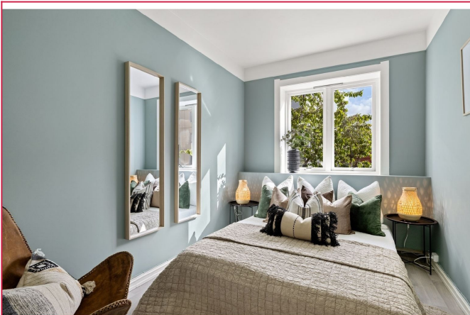
Hovedsoverommet er lyst og romslig