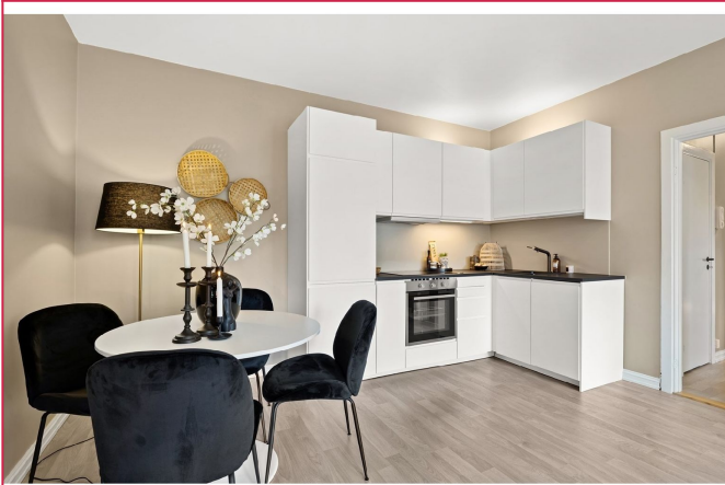
Lekker kjøkken fra 2021!