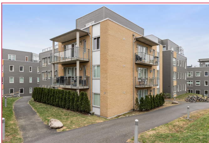
Leiligheten ligger i 3. etasje i et etablert sameie.