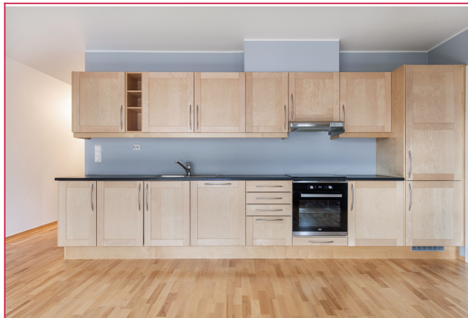
Kjøkkenet har godt med skap-plass og integrerte hvitevarer.