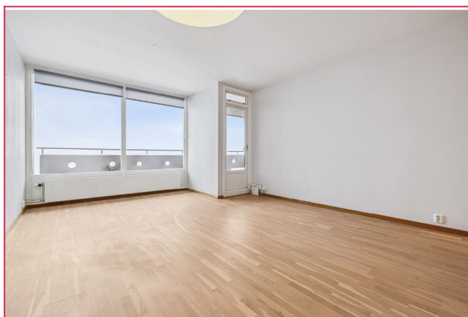
Romslig stue med utgang til balkong med fantastisk utsikt