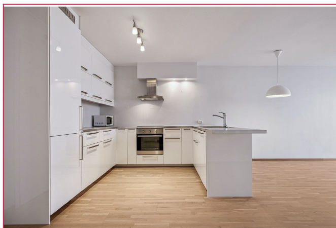
Lyst kjøkken med integrerte hvitevarer