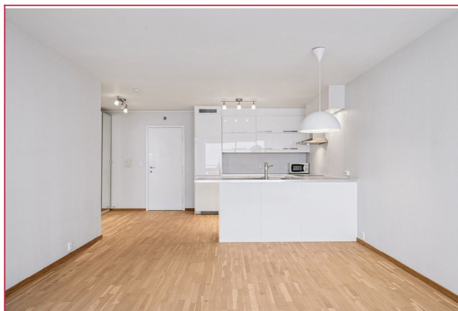
Entré med lite garderobeskap, åpen løsning mellom stue og kjøkken