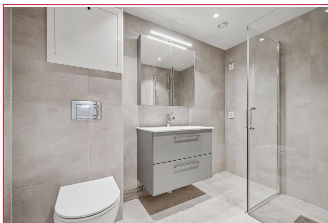
Helt nytt bad med dusjkabinett, toalett, servant i innredning og opplegg for vask og tørk