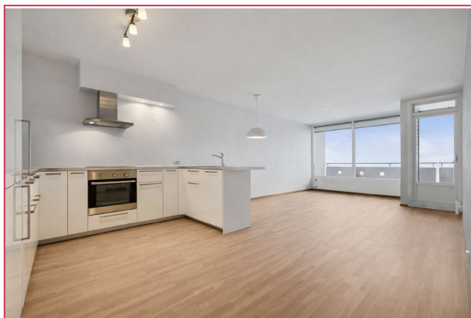
Åpen løsning mellom stue og kjøkken. Store vindusflater

SAKSNUMMER 31933 - TORD PEDERSENS GATE 89 B, 3014 DRAMMEN