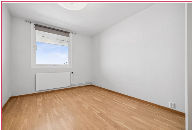
Soverom med garderobeskap