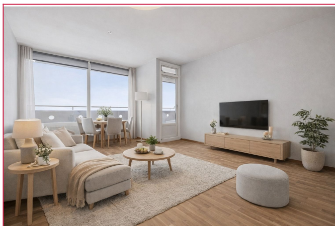
Digitalt møblert bilde