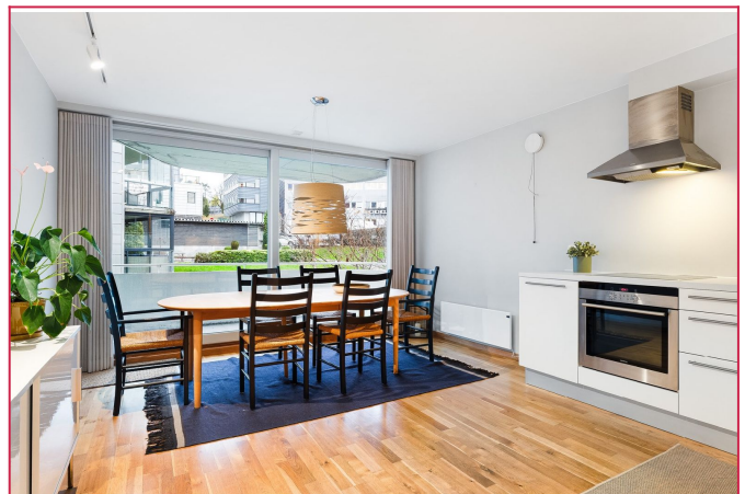
Kjøkken med spisegruppe.