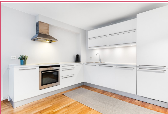
Kjøkken med hvitevarer.