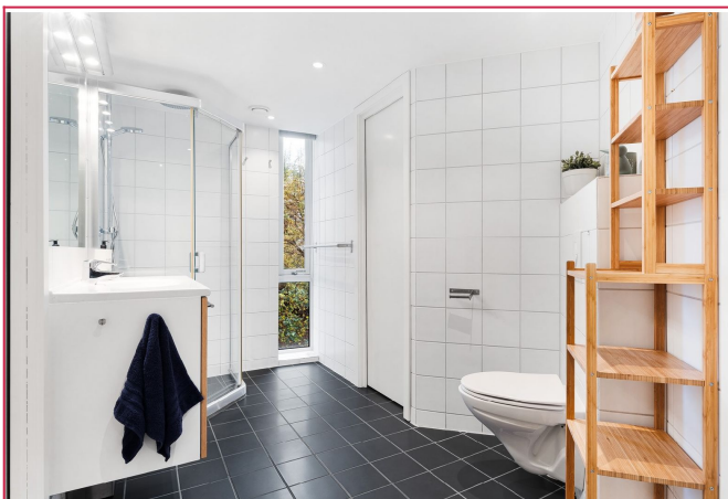
Baderom med fliser på gulv og vegger, og varme i gulv.