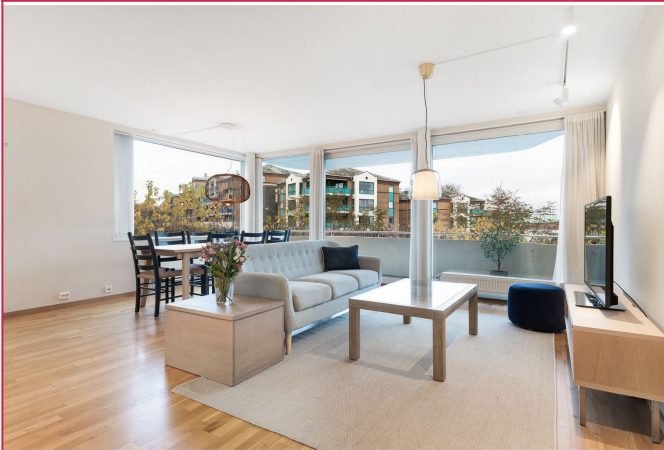
Stue med tilkomst til balkong.