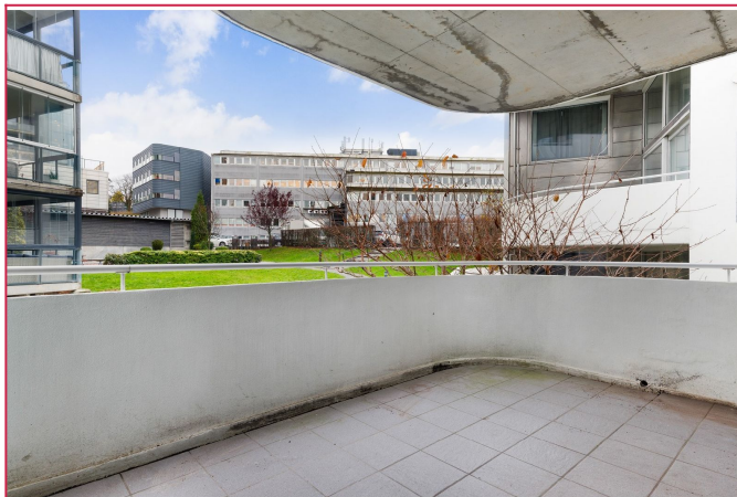
Balkong med tilkomst fra kjøkken.