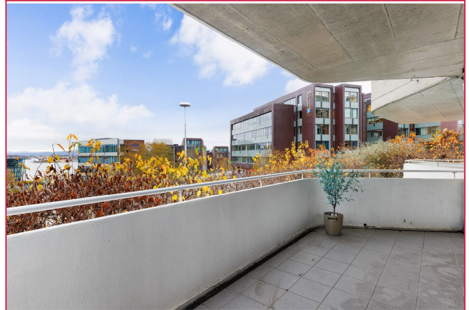
Balkong med utsikt til sjø.