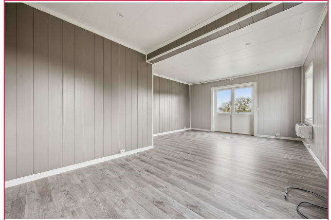
Lys og fin stue - Utgang til terrasse. Varmepumpe innstallert.