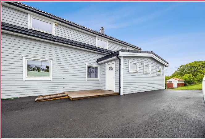
Velkommen til Blomøyveien 157!