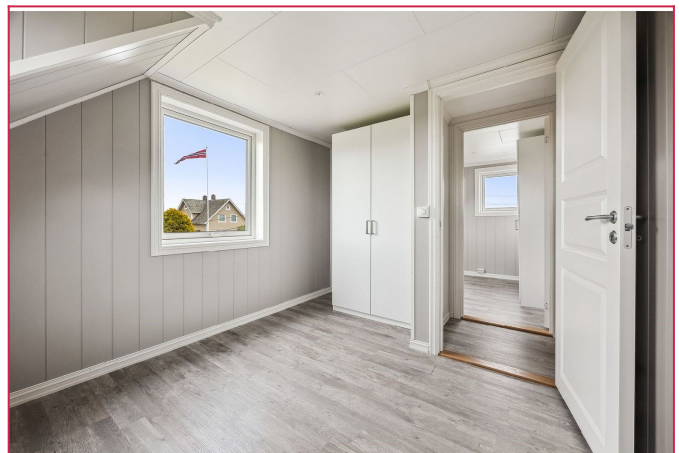
Soverom 1 i 2.etg. , Lyst og fint soverom m/garderoreskap.