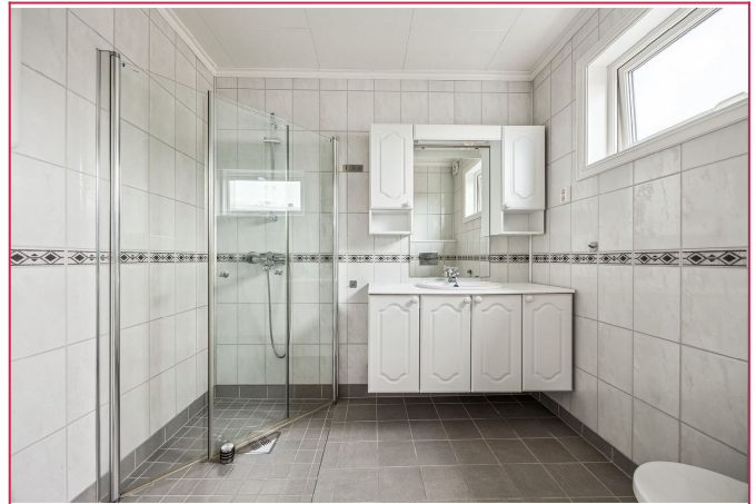
Lyst og fint helfliset bad.