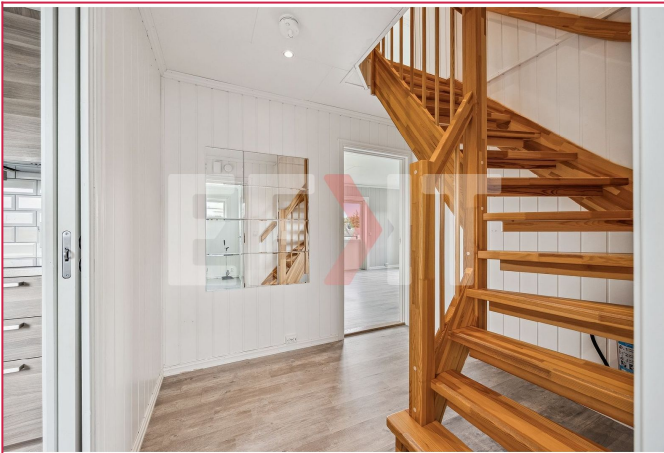
Entre/hall: Trapp opp til 2.etg.