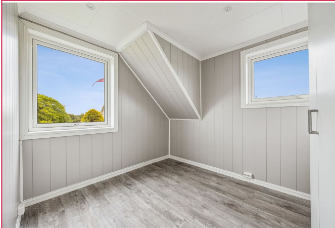
Soverom 2 i 2.etg. Lyst og fint soverom.