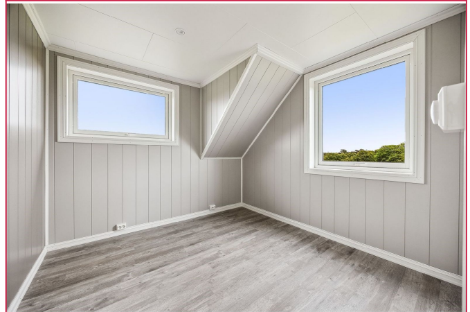
Soverom 3 - Lyst og fin soverom