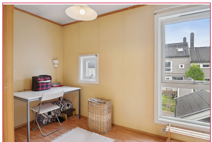
Soverom 3- nå benyttet som kontor