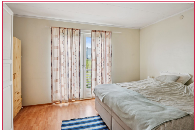
Hovedsoverom med garderobe og fransk balkong