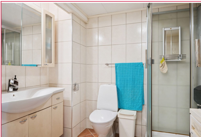
Bad med dusjkabinett og alt av hvitevarer