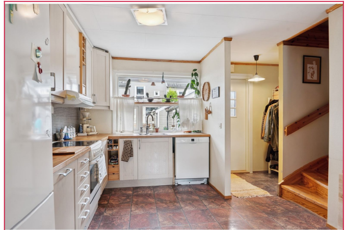
Komplett kjøkken med alt av hvitevarer og utstyr inkludert