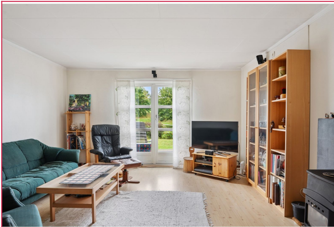
Fin stue med utgag til koselig hage