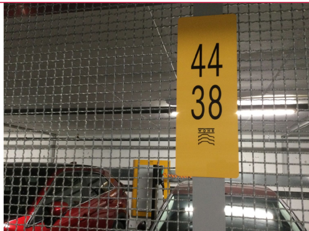
Parkering i heis (maks 2600kg!)