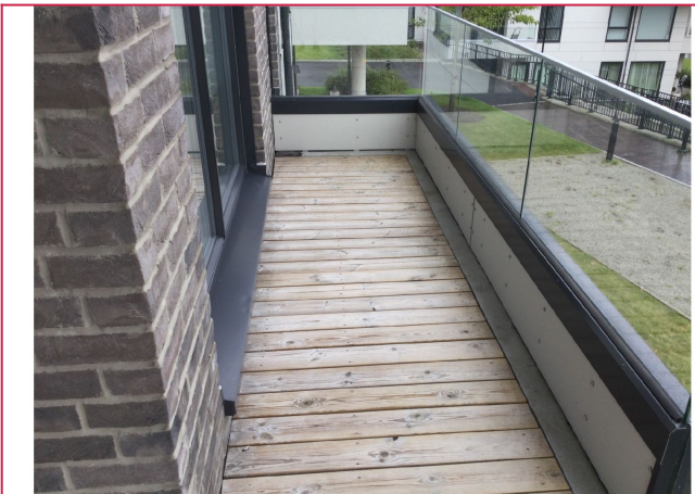
Terrassen har ulike soner.