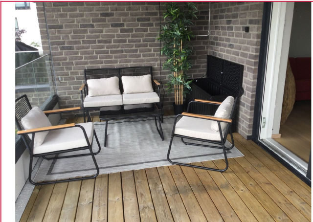
Hyggelig sone på terrasse.