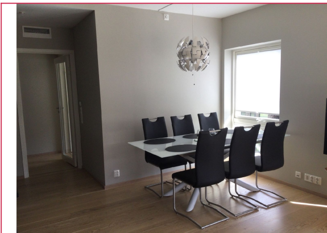
Spisebord plassert ved kjøkken.