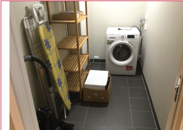
Bod/vaskerom. Vaskemaskin medfølger.