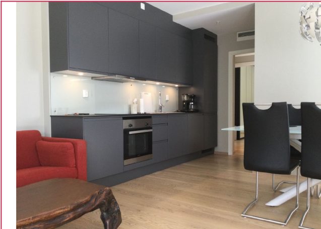
Alt av kjøkkenutstyr medfølger.