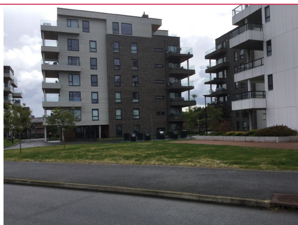
Kontakt megler for visning.