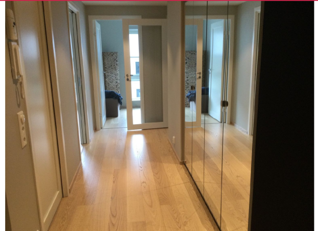
God plass til oppbevaring av yttertøyet i skap.