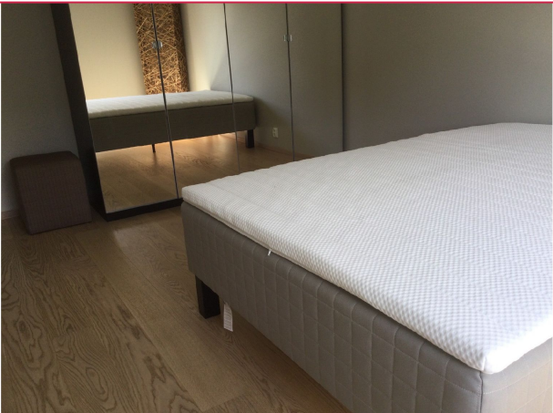
Hovedsoverom med dobbeltseng og garderobeskap.