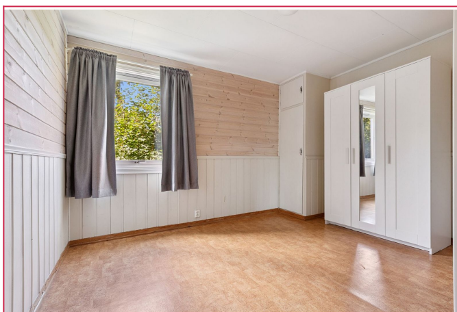
Leiligheten blir leid ut slik som vist på bilder