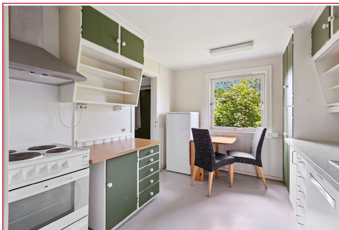
Kjøkken med god skap og benkeplass