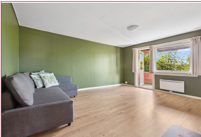
Det er peis og varmepumpe i stuen