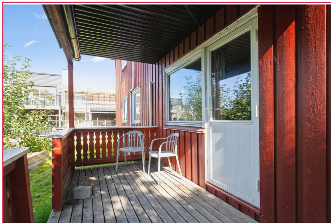
Fra stuen er det utgang til markterasse og hage