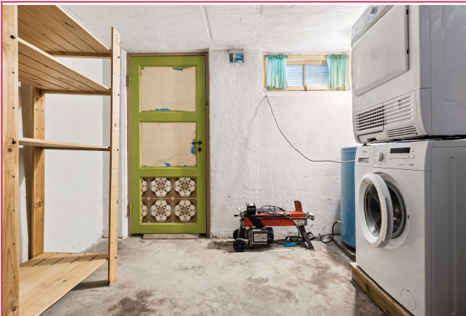
Vaskerom i kjeller som man deler med leilighet under.