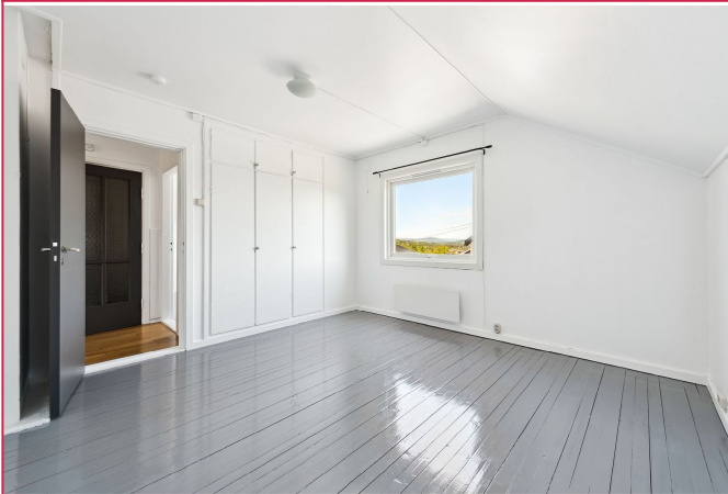
Soverom med innebygd garderobe.