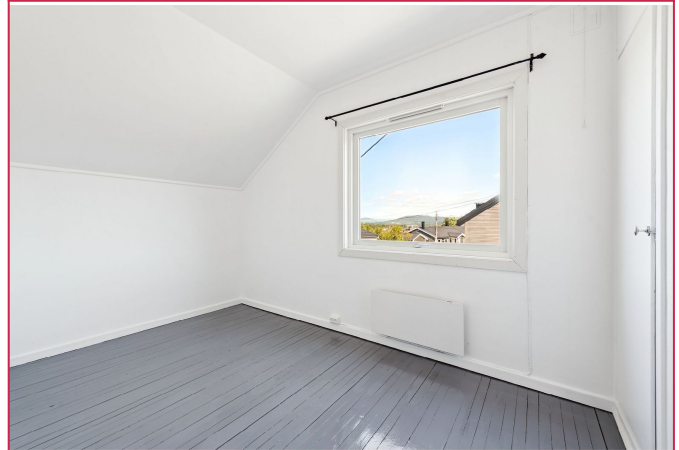
Soverom 2 er også av grei størrelse.