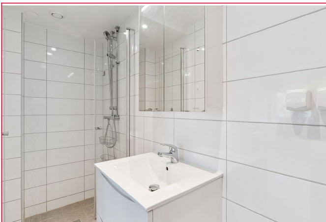
Pent flislagt bad med opplegg for vaskemaskin