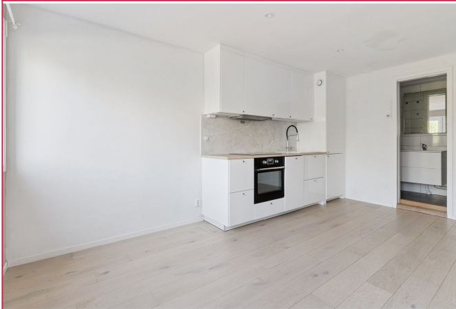
Kjøkken med integrete hvitevarer