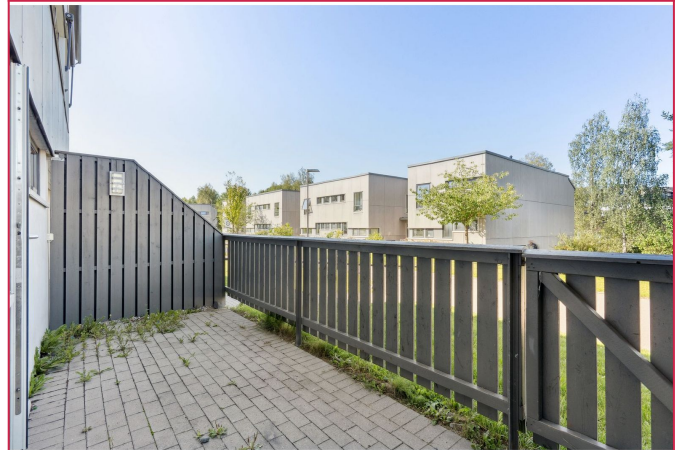
Stor terrasse med god plass til utemøblement og grill