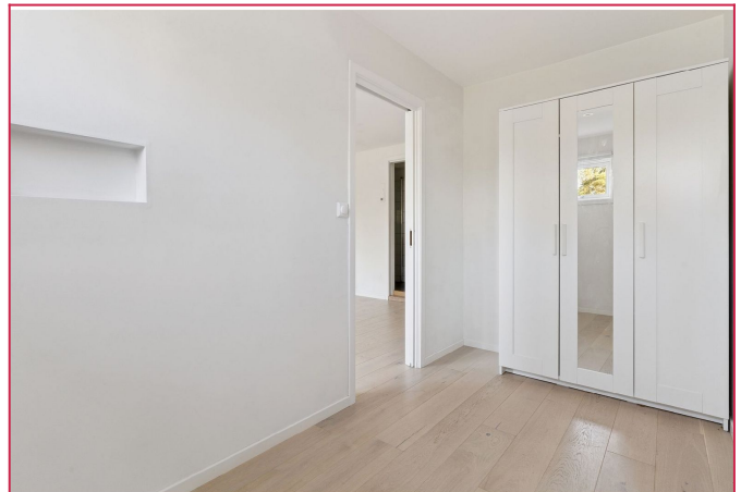
Garderobeskap på soverom medføkger