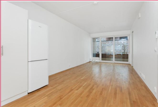
Romslig stue med gode møbleringsmuligheter