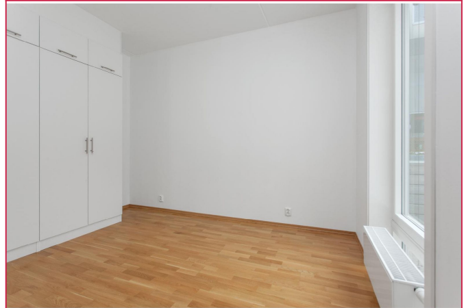
Hovedsoveromme fremstår som lyst og romslig. Plass til dobbeltseng