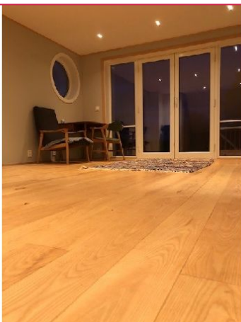
Downlights i himling