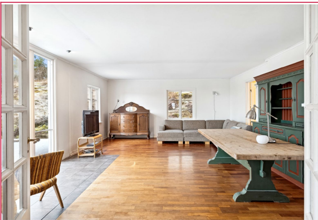
Stor stue med direkte utgang til terrasse!