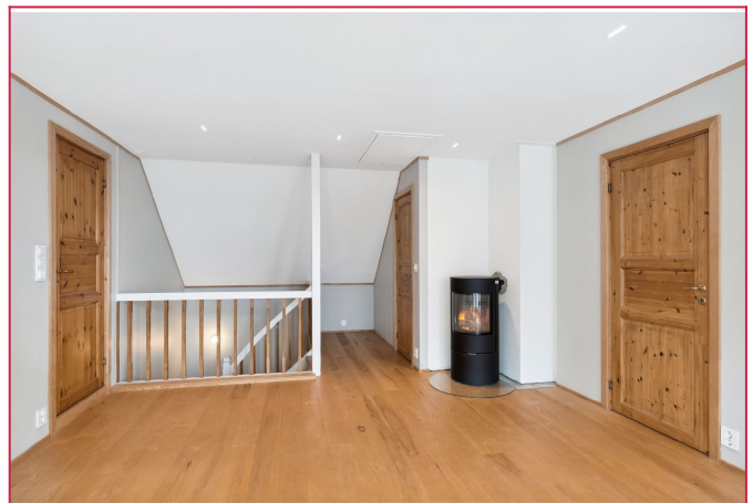
Loftstuen har en peisovn som varmer godt!