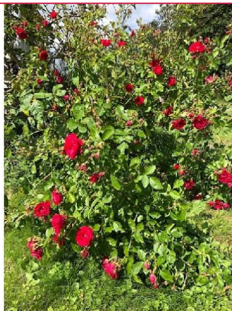
Blomster i hagen