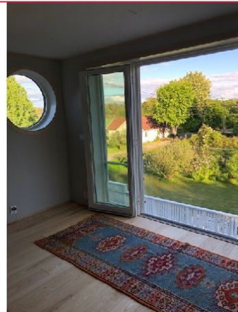
Fantastisk utsikt fra den franske balkongen!