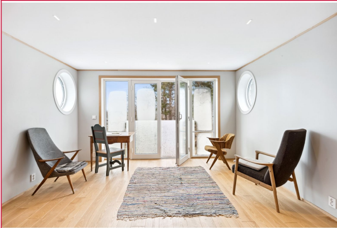
Flott loftstue i 2.etg med fransk balkong og fantastisk utsikt!