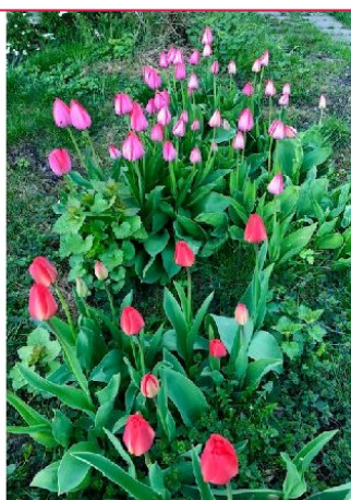
Blomster i hagen