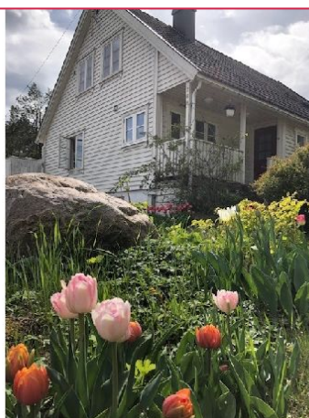
Velkommen til visning!