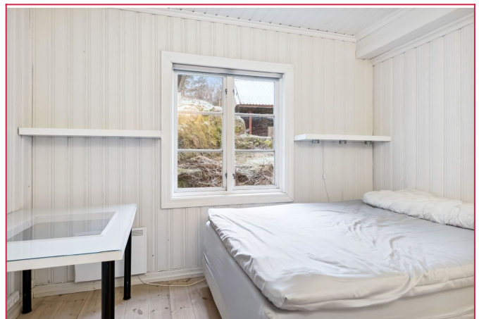
Soverom i 1.etg