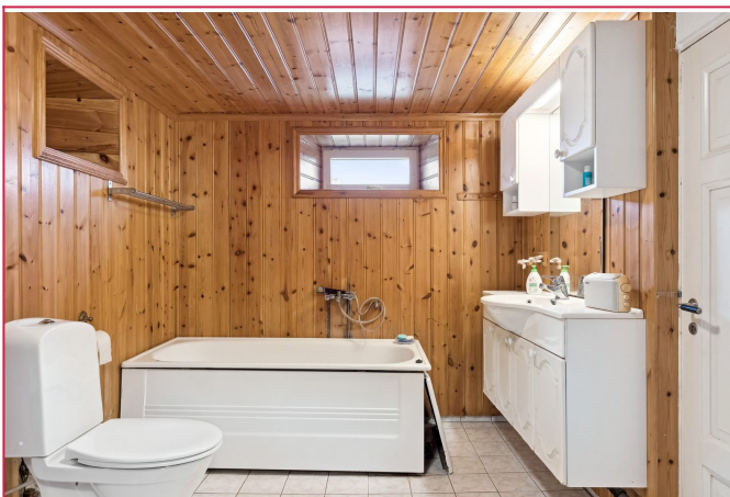
Bad i under etg med toalett, badekar og servant m/innredning