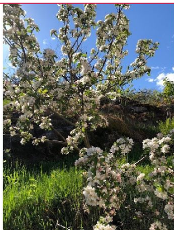
Blomster i hagen