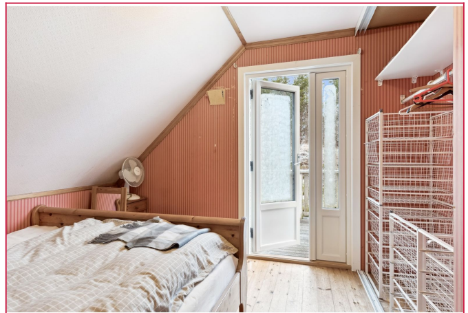
Soverom i 2.etg. Direkte utgang til balkong