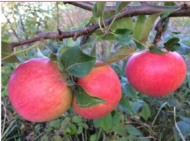
Epletre i hagen