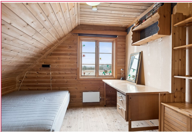
Soverom i 2.etg - Pr idag er det delvis nymalt i hvitt. Nytt vindu