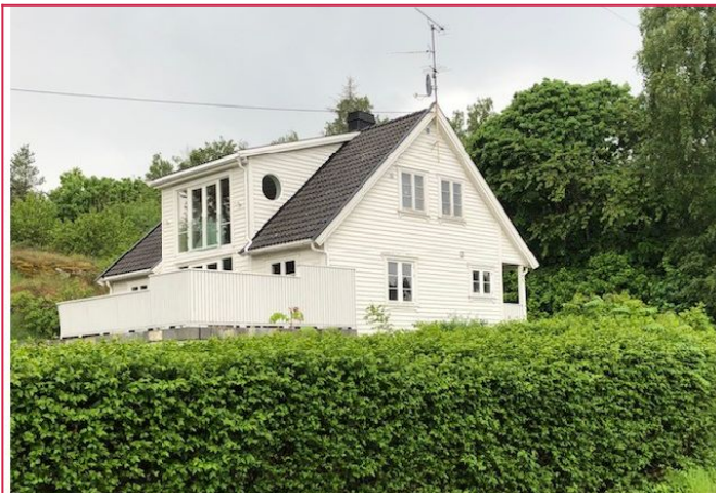
Innholdsrik enebolig med landlig og rolig beliggenhet