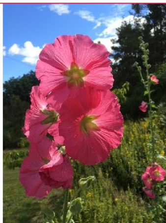
Blomster i hagen