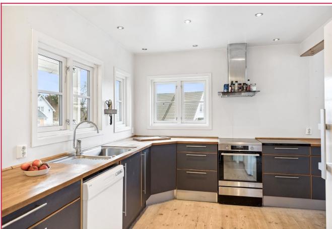
Lekker kjøkkeninnredning med mye skap- og benkeplass!