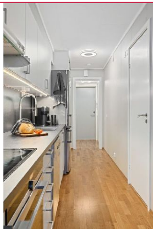
Lys entre med integrerte garderober gir gode muligheter for oppbevaring av yttertøy og sko.