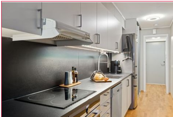
Moderne kjøkken med gode lagringsmuligheter.