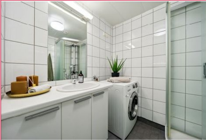
Lyst og romslig bad. Vaskemaskin følger med.