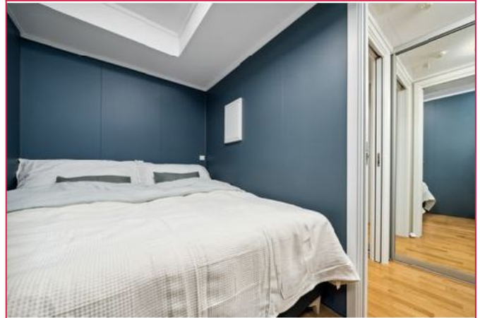
Romslig soverom. Seng og Kommode følger med.