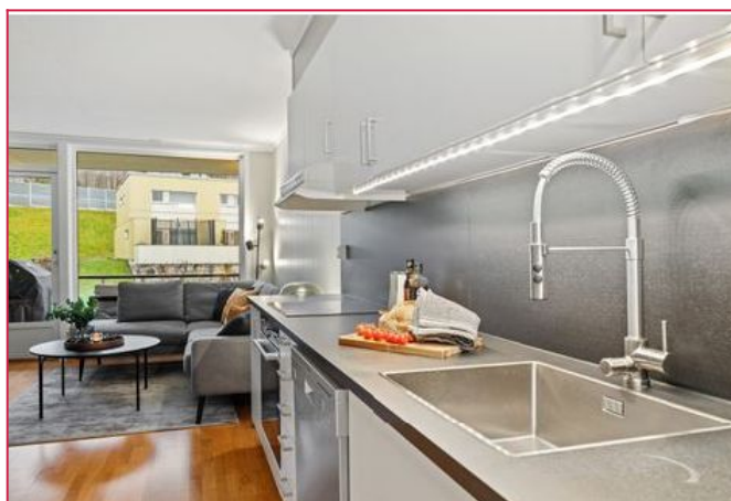
Åpent kjøkken. Komfyr, koketopp, kombiskap, oppvaskmaskin og mikrobølgeovn følger med.