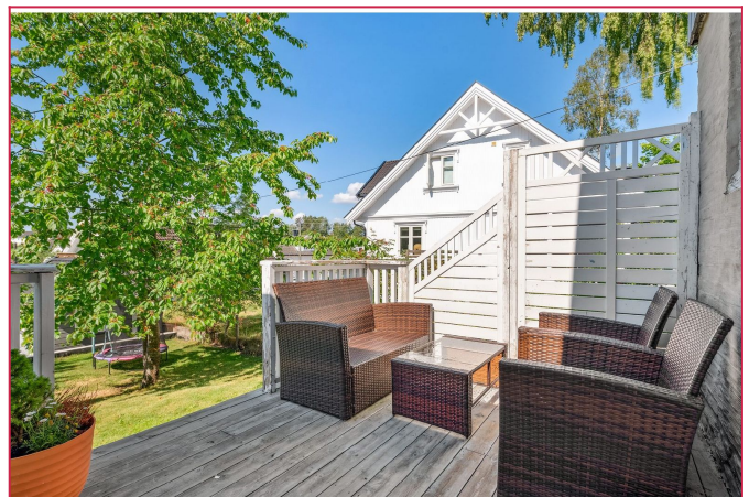
Hyggelig terrasse mulighet