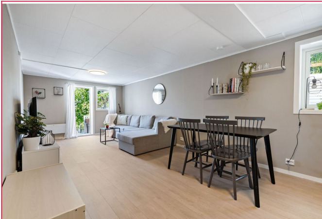
Det er utgang til hagen fra stuen