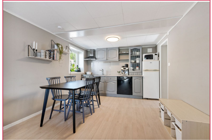
Hyggelig stue/kjøkken løsning med mulighet for spisebord og tv krok