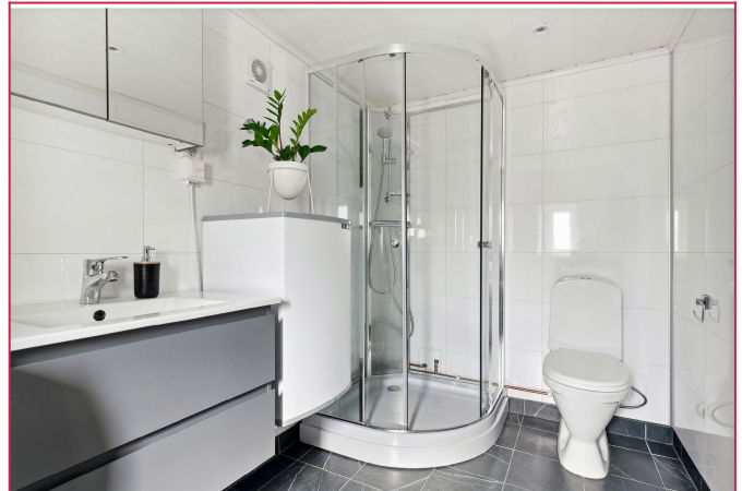
Bad med vaskemaskin