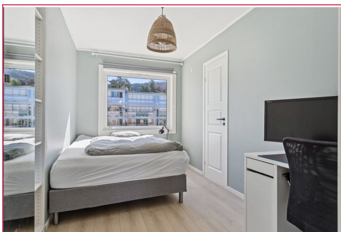
Hoved-soverom – Rommet har bod/walk-in garderobe