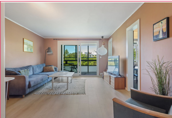
Stor og lys stue