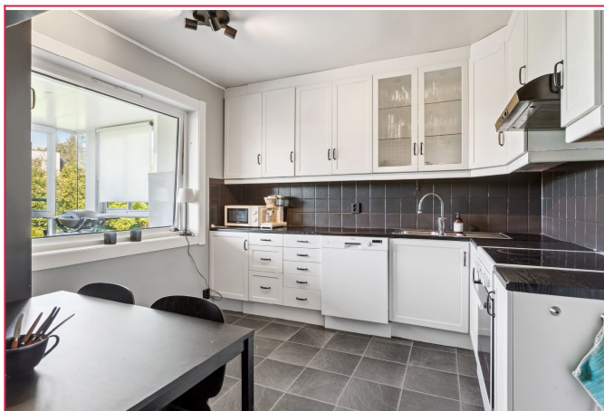
Godt med skaplass på kjøkkenet