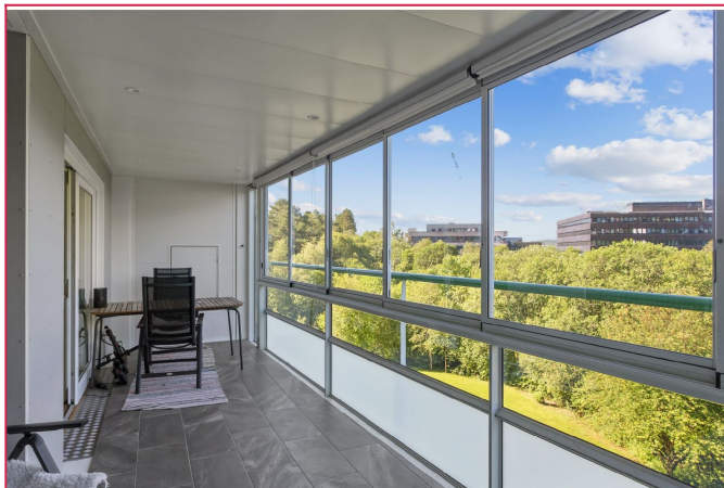
Solrik balkong – Gjennom skogen går det sti til oasen senter