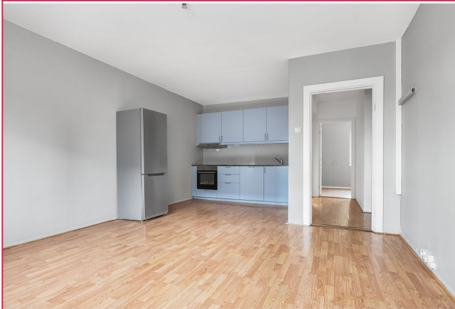
Åpen kjøkkenløsning mot stue, hvitevarer medfølger.