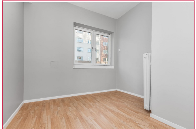
Nyetablert soverom som også vender ut mot rolige omgivelser.