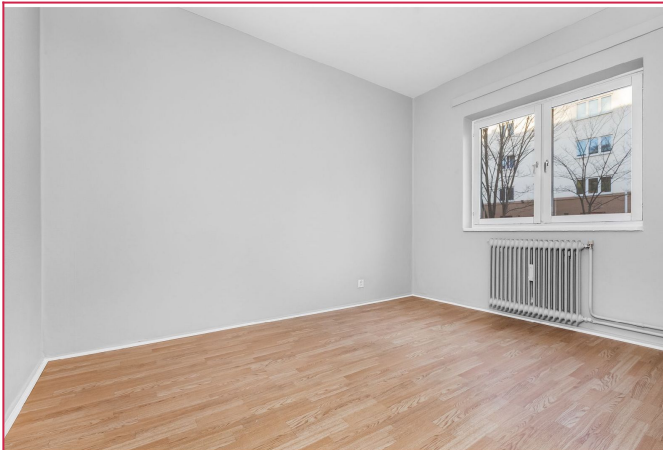
Romslig soverom, vender ut mot rolige omgivelser.