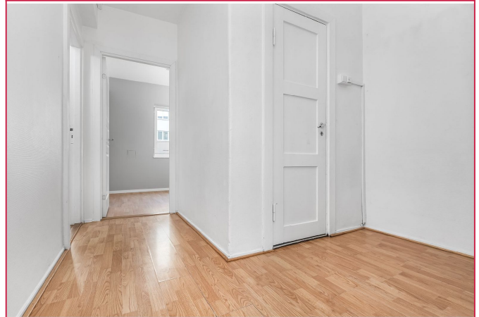
Entre med god plass til klær og sko.