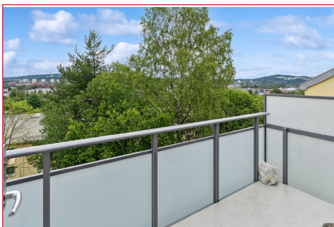
Balkong med nydelig utsikt over Oslo