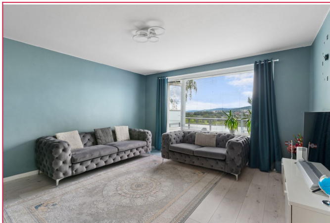
Romslig stue med store vindusflater og direkte utgang til balkong