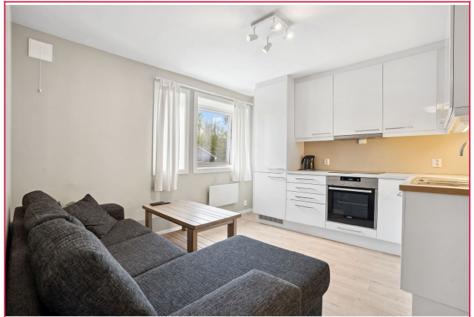
Stue og kjøkken