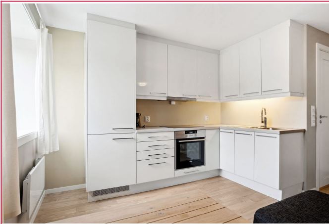
Kjøkken med diverse integrerte hvitevarer