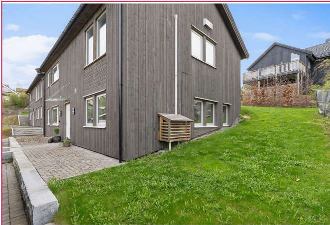
Uteområde med felles hage