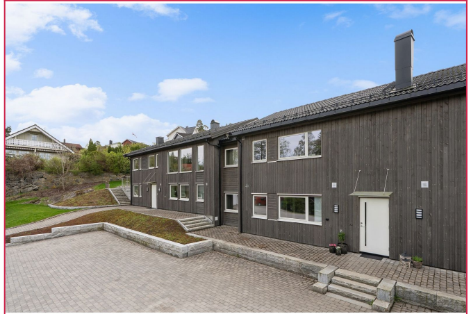
Uteområde og parkeringsplasser