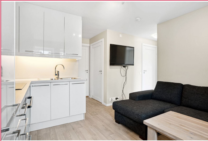
Stue med åpen kjøkkenløsning