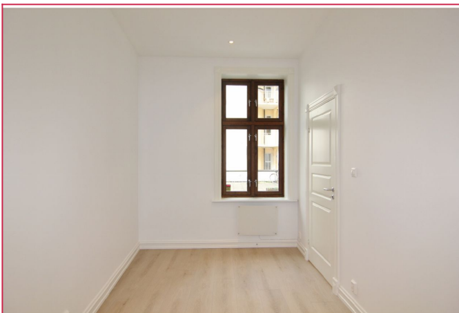
Begge soverommene har plass til stor seng og garderobeskap.