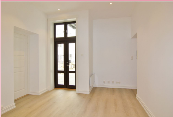
Entreèn med plass til å henge fra seg klær og sko.