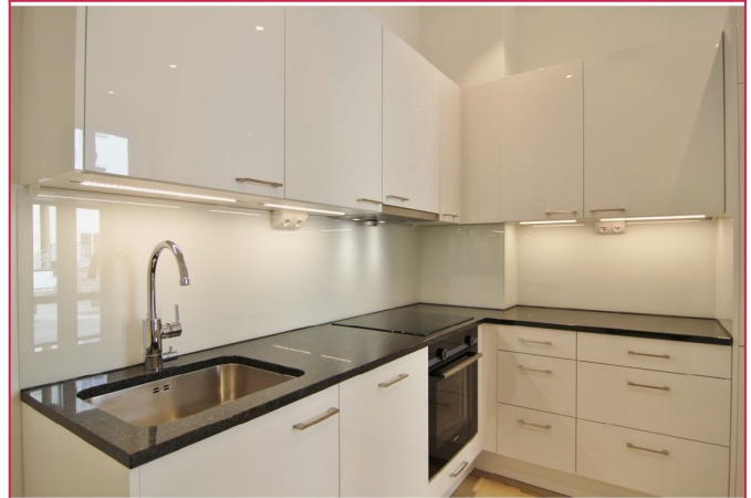
Kjøkkenet med lyse fronter og integrerte hvitevarer. Åpen løsning mot stue.