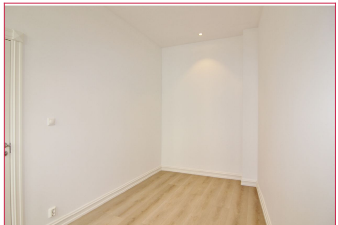
Lysmalte vegger og downlights i himling.