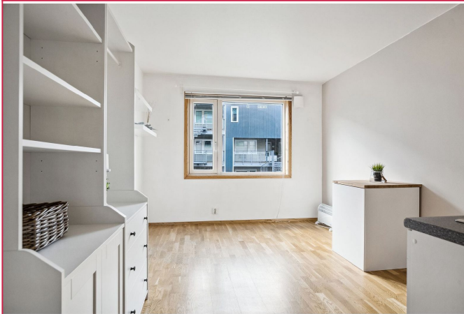
Stort vindu og åpen kjøkken/stue-løsning gir leiligheten en lys atmosfære.