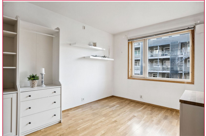
Strøm, internett, varmtvann, V&A-utgifter og TV inkludert i leien.