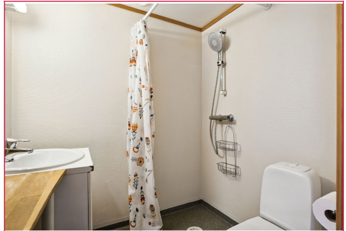
Varmtvann og vann- og avløpsutgifter er inkludert i leien.