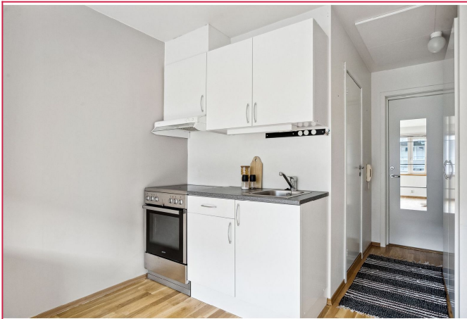
Kjøkkenet i klassisk design