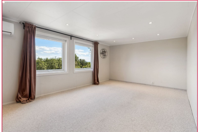
Anekset over garasjen har et stort rom/stue.