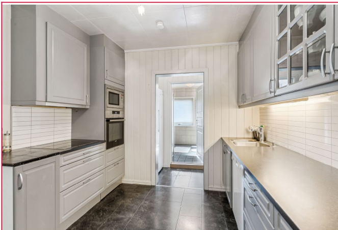
Kjøkken med integrerte hvitevarer.