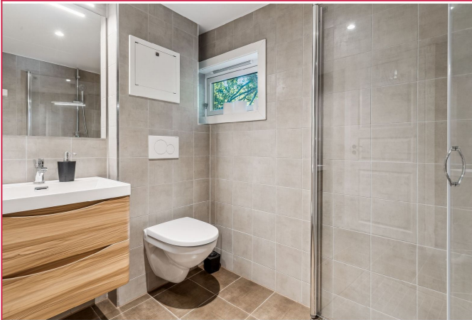
Anekset har også et nyere bad.