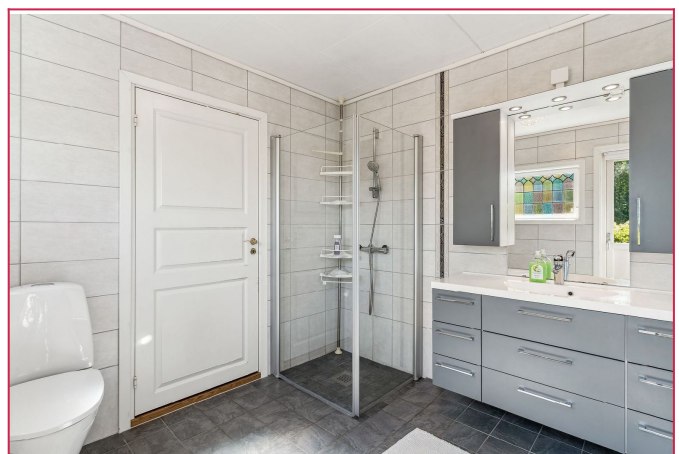
Baderom med varmekabler.