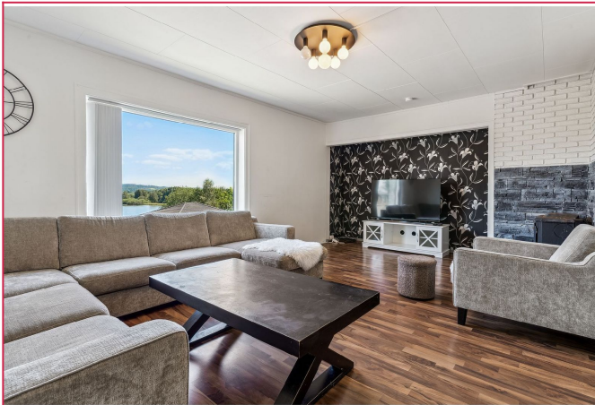
Boligen har en romslig stue.