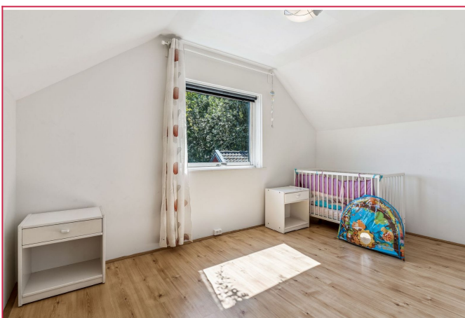
Soverommene er av god størrelse.