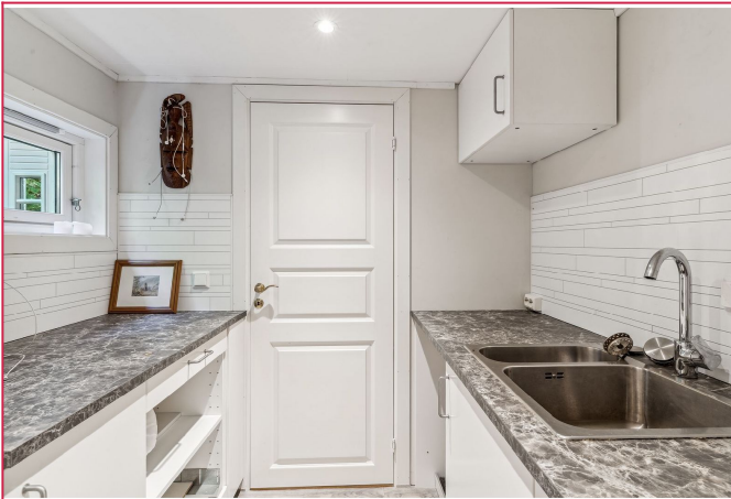
Annekset har også benkeplater med vask.