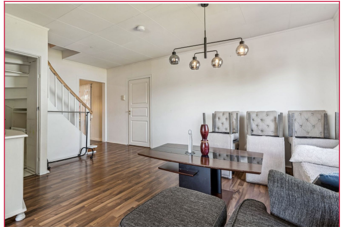
Stuen har god plass til en spisegruppe.