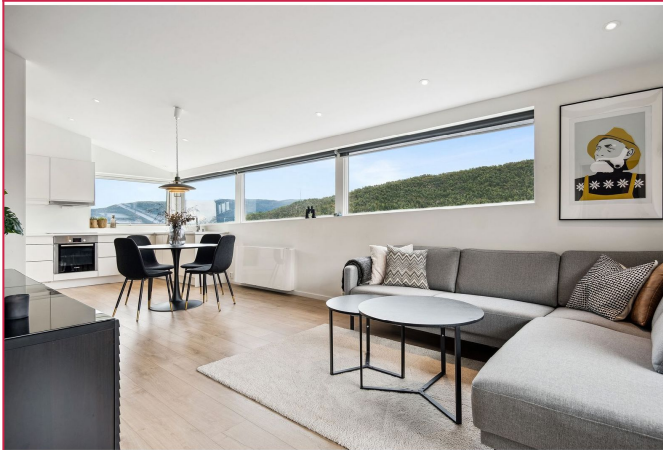
Romslig stue som er møblert med sofagruppe og spisebord.