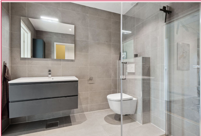
Moderne bad med servant, toalett og dusj. Separat vaskerom med vaskemaskin og tørketrommel.