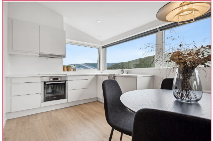
Kjøkkenet med integrerte hvitevarer og nydelig utsikt.