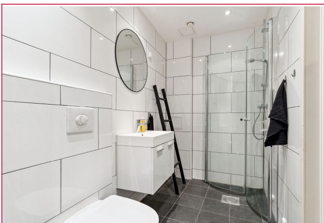
Baderom med dusjhjørne, vegghengt toalett og varme i gulv