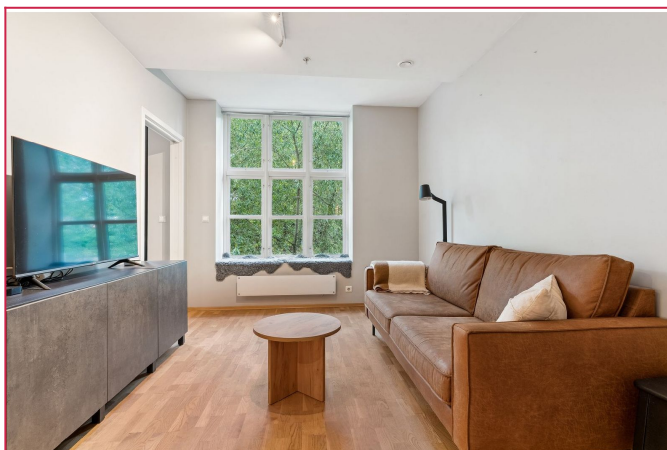
Leiligheten oppleves som luftig med god takhøyde og elven rett utenfor stuevinduet