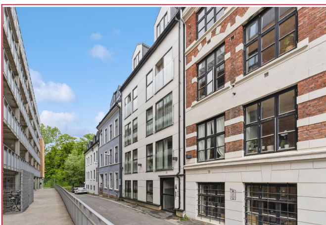
Fasade - Leiligheten ligger i et rolig, men samtidig sentralt område med kort vei til off.komm