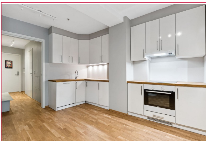
Kjøkkenet har integrerte hvitevarer og godt med skap- og benkeplass