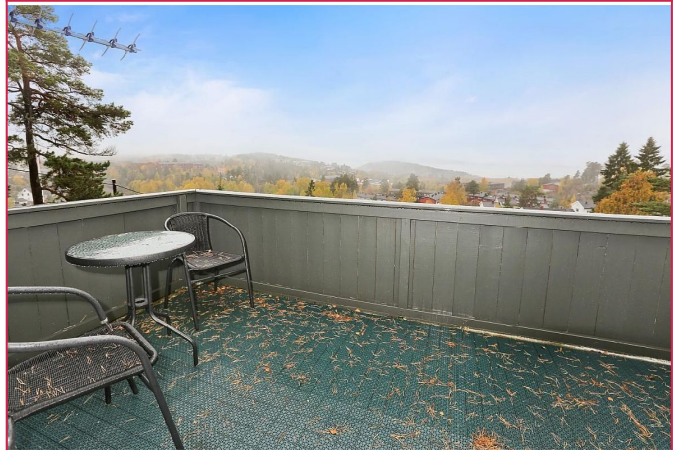
Solrik balkong utgang fra stue