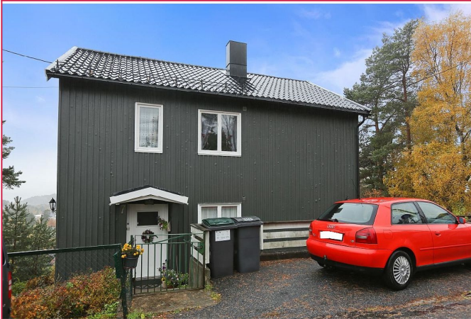
Fasade. Leiligheten ligger i 2. etasje.