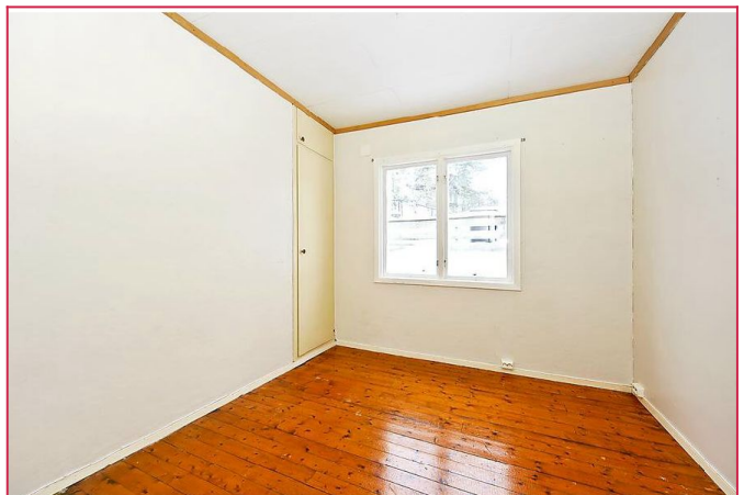
Soverom nr. 2 umøblert