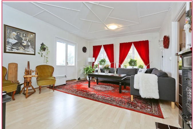
Stuen har ingen av disse møblene med i leien, kun med for å vise at veggene er malt lysere.