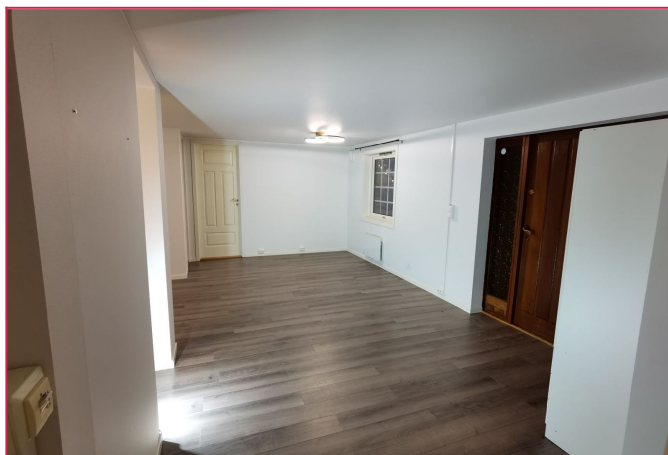
Stue/ inngangsparti etter oppussing