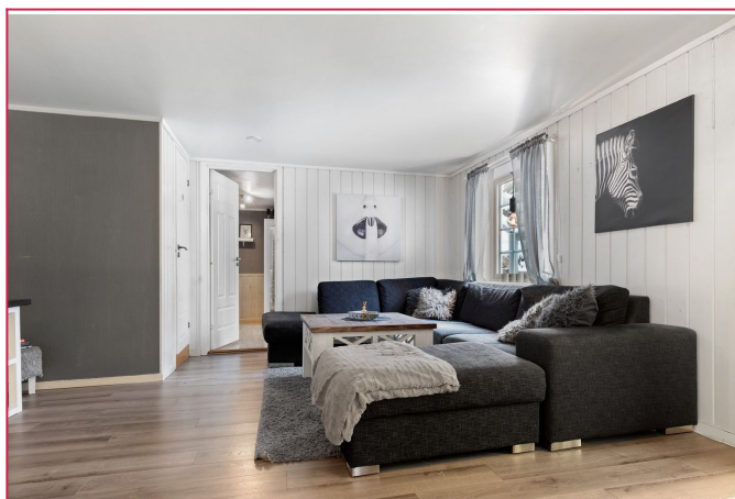
Stue - Leiligheten er pusset opp i etterkant av bildene