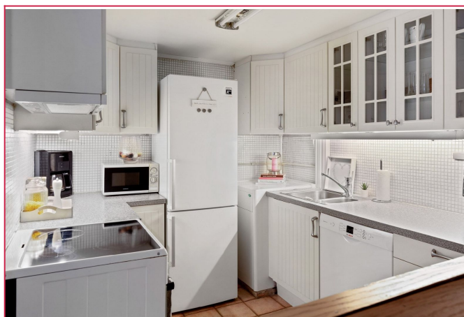
Kjøkken - Kjøkken er som på bilde