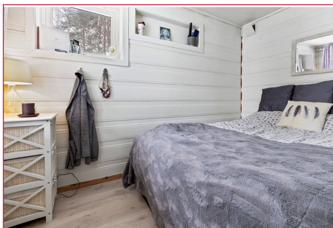
Soverom - Leiligheten er pusset opp i etterkant av bildene