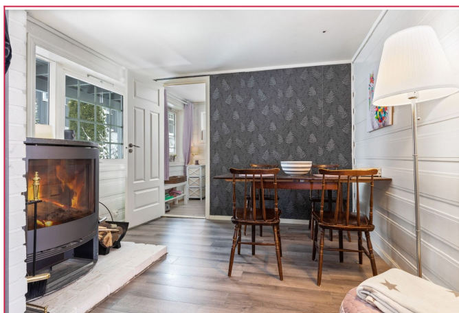
Spisestue med peis - Leiligheten er pusset opp i etterkant av bildene