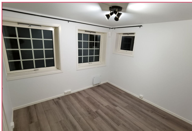
Soverom etter oppussing