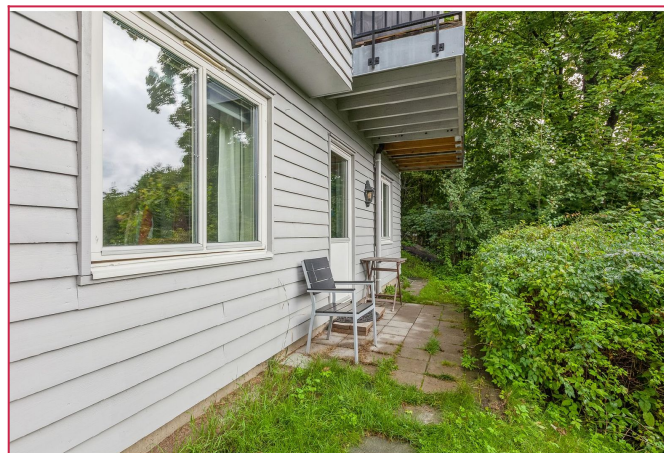
Uteområde leietaker kan benytte seg av. Her er det sol fra morgen til ca. kl. 15.