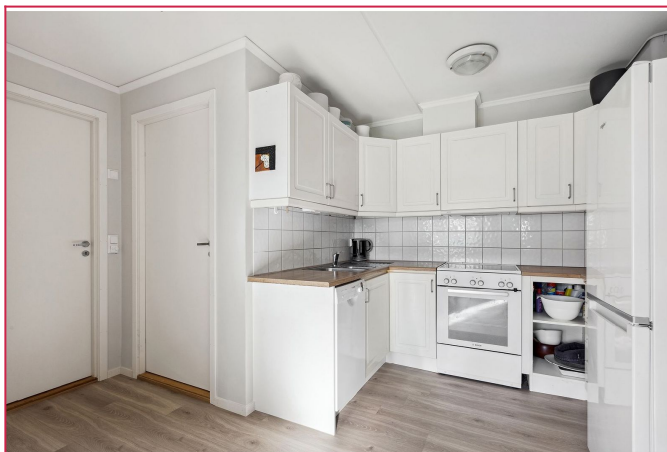
Kjøkken med frittstående hvitevarer inkludert