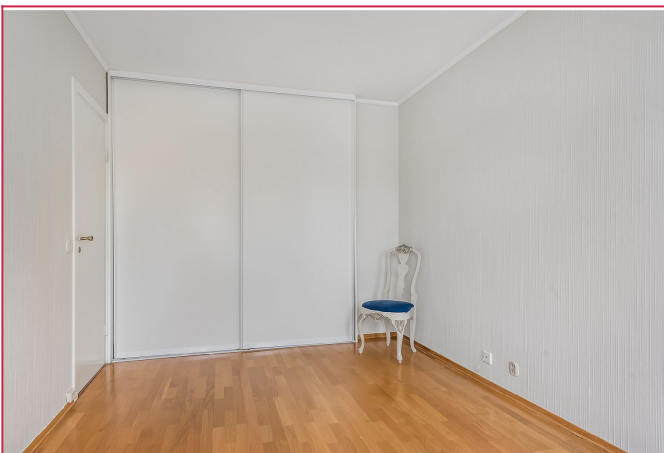
Soverom 1 med skyvedørgarderobe