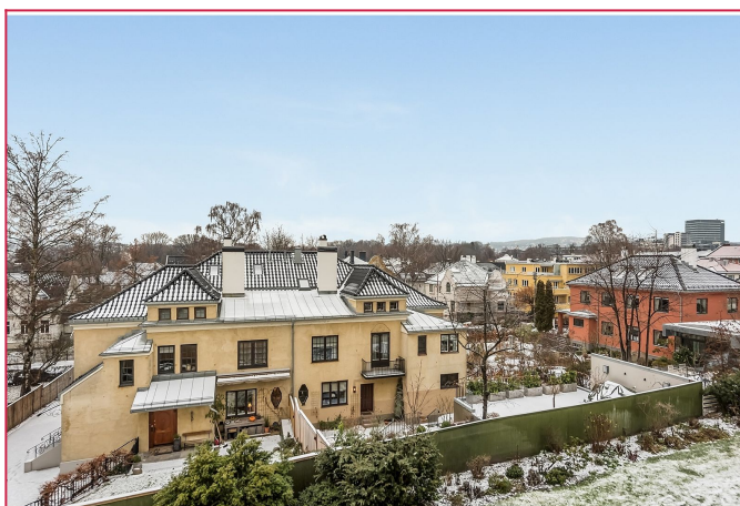
Fin utsikt mot Holmenkollen