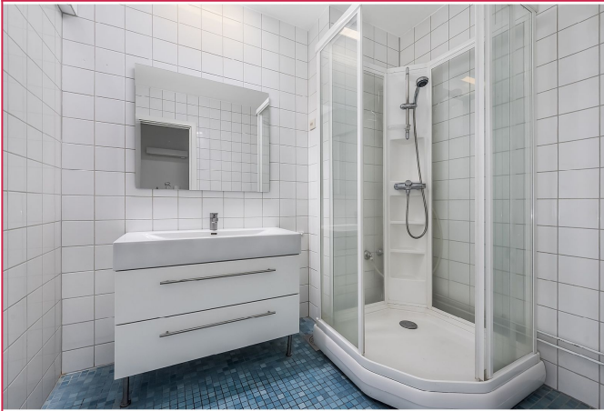
Flislagt bad med servant og dusjkabinett