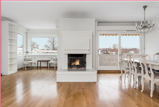
Romslig stue med utgang til balkong