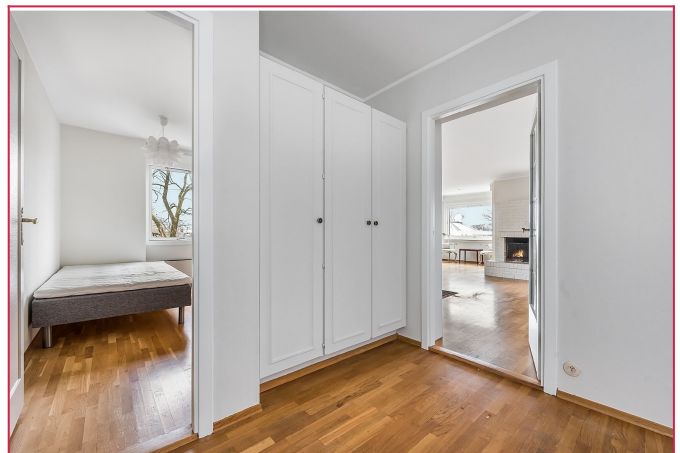
Soverom 2 med garderobeskap