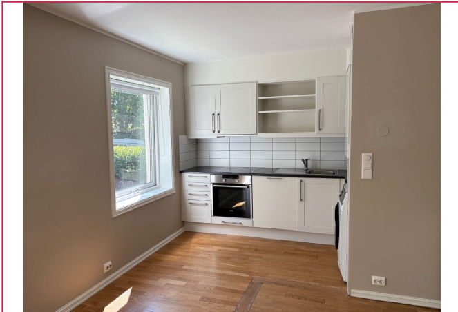
Utleieres egne bilder ett fjerning av kjøkkenøy