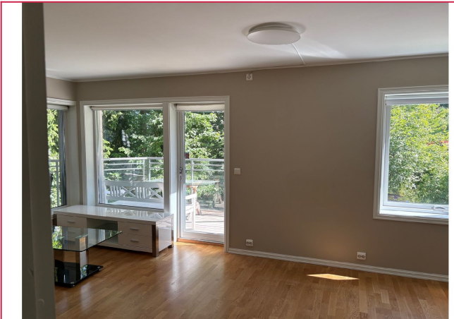
Utleieres egne bilder etter fjerning av kjøkkenøy