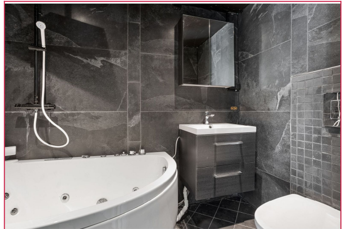
flislagt bad med badekar