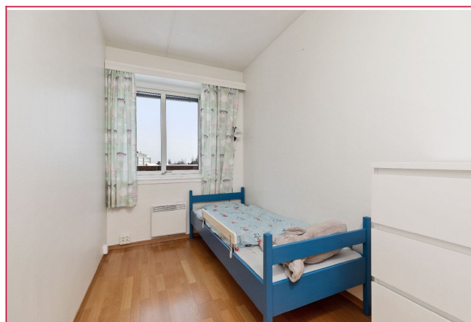
Soverom 2. Garderobeskap medfølger.