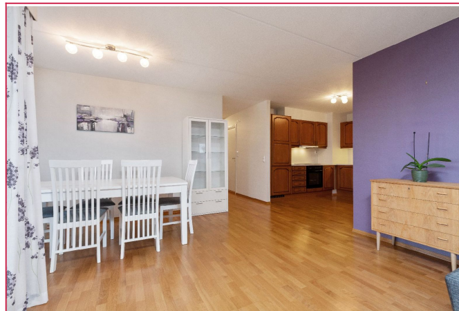
Spisestue mot kjøkken.