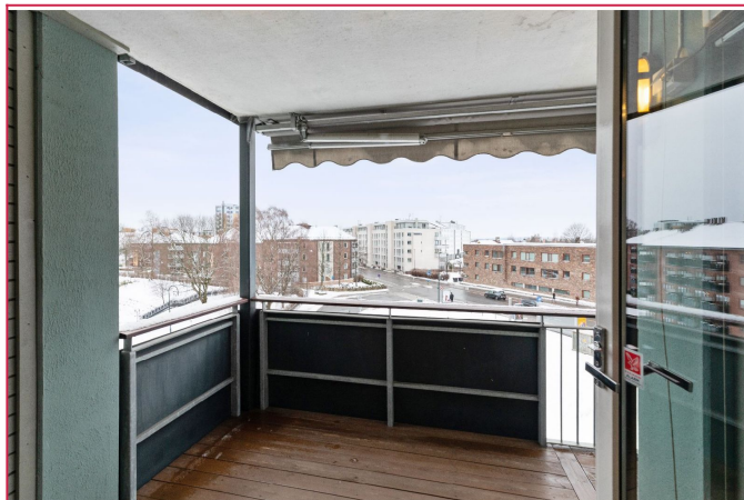
God utsikt fra 5. etg. Vestvendt med gode solforhold.