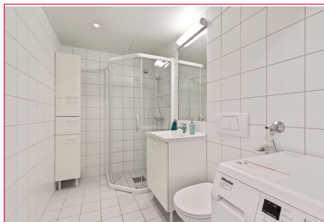
Flislagt bad med gulvvarme. Vaskemaskin medfølger.