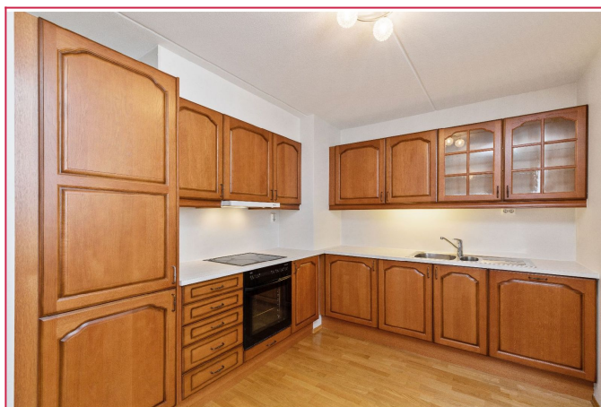
Romslig kjøkken med integrert kombiskap, komfyr og oppvaskmaskin.