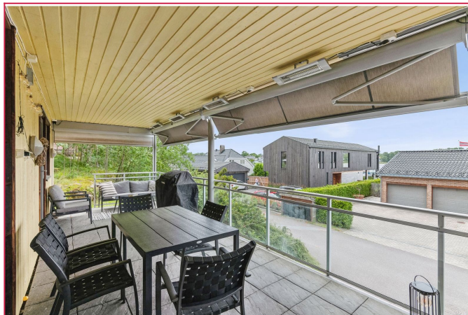
Stor, overbygget balkong med solskjerming.