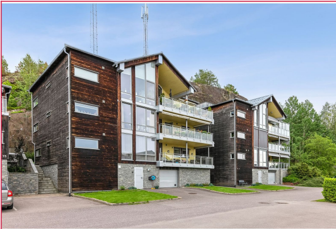
Leiligheten ligger i 2. etasje av bygget. Velkommen til visning!