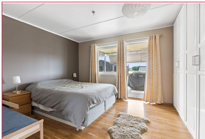
Hovedsoverommet er lyst og luftig, og har direkte utgang til balkongen.