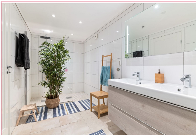
Delikat, flislagt bad.