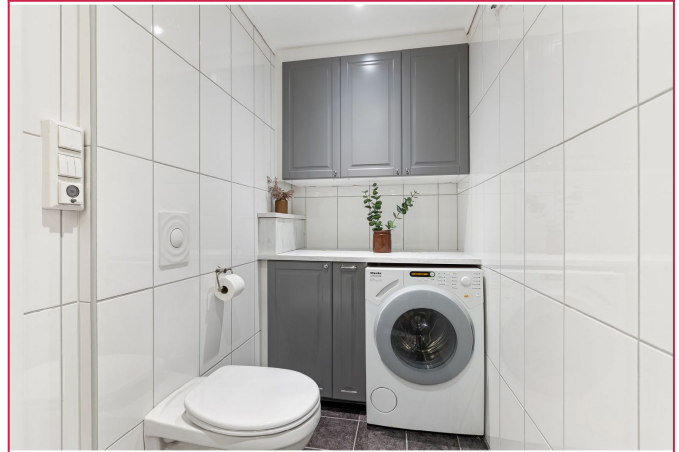
Separat WC med vegghengt toalett, servant, vaskemaskin og skaplass.