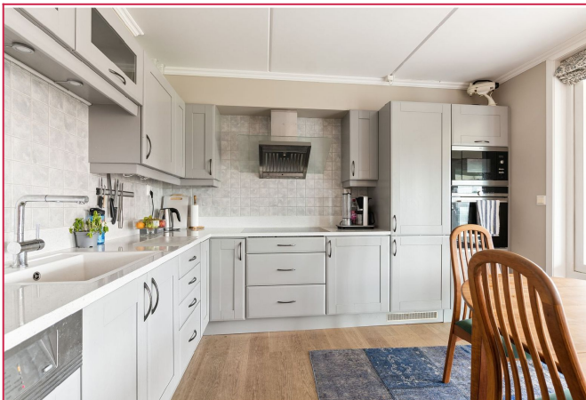
Lekker kjøkken med integrert komfyr, steketopp, kombiskap, mikro og vinkjøleskap.