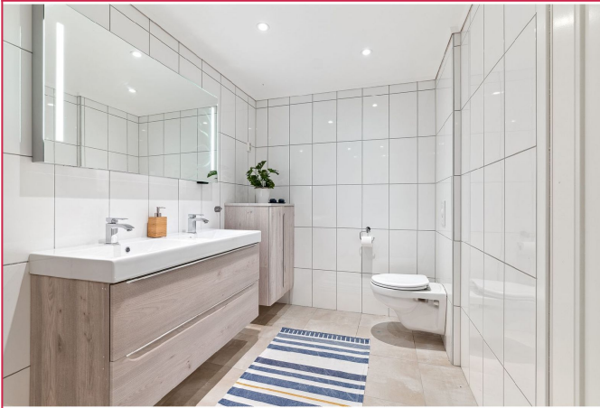
Badet er innredet med stor dusj, vegghengt toalett og dobbeltservant m/innredning.