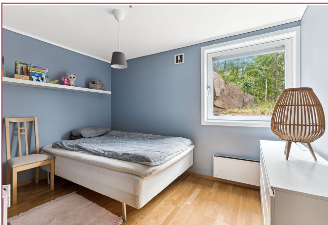
Soverom 2 har en avslappet atmosfære.