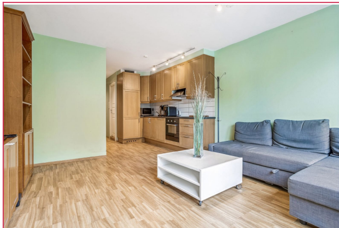
Stuen og kjøkkenet ligger i en åpen løsning