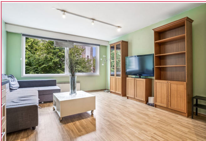
Leiligheten er 33 kvm og leies ut møblert