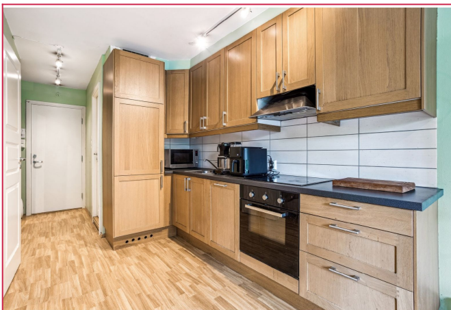
Kjøkkenet inneholder kombiskap, komfyr, steketopp, airfryer og noe kjøkkenutstyr