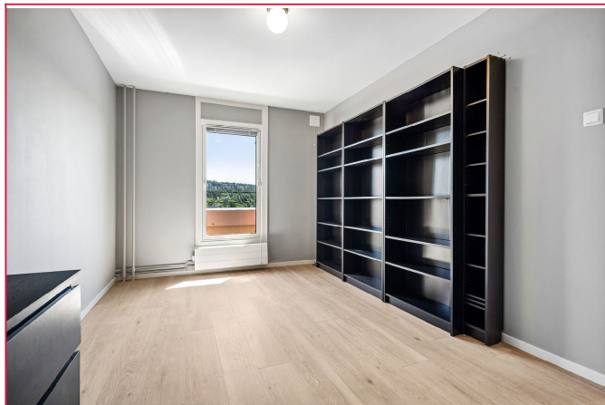
Leiligheten har totalt 2 soverom av god størrelse