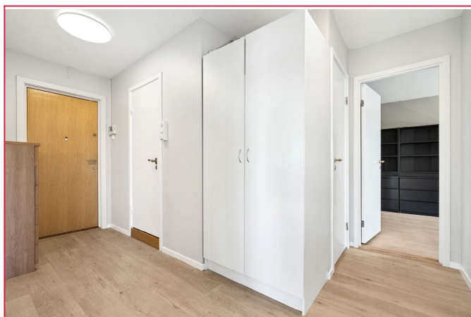
Lys entrè med god plass til å henge fra seg yttørtøy og sko