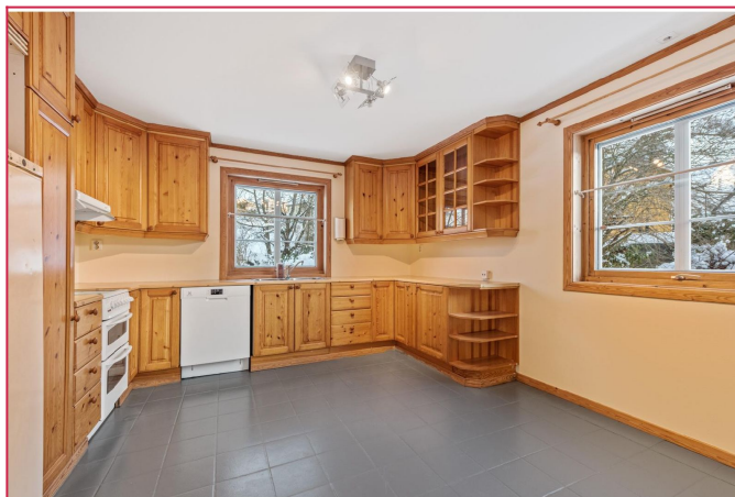
Romslig kjøkken med spiseplass