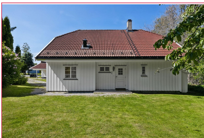
Fasade av inngangsdøren