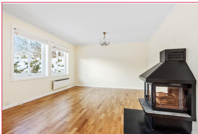
Stue med peis