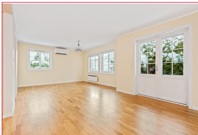
Spisestuen med utg til terr og hage