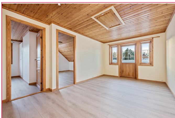
Loftsgang med utg. balkong