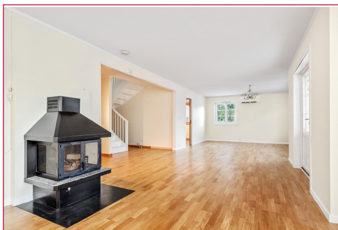
Stor stue med peis, mot spisestuen