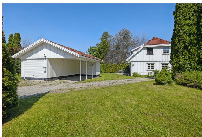
Fasade fra oppkjørselen med garasje og carport