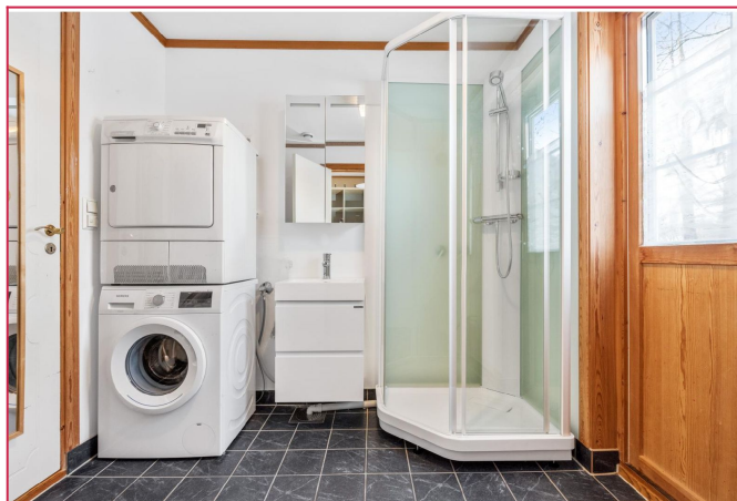
Vaskerom/bad i 1.etg.