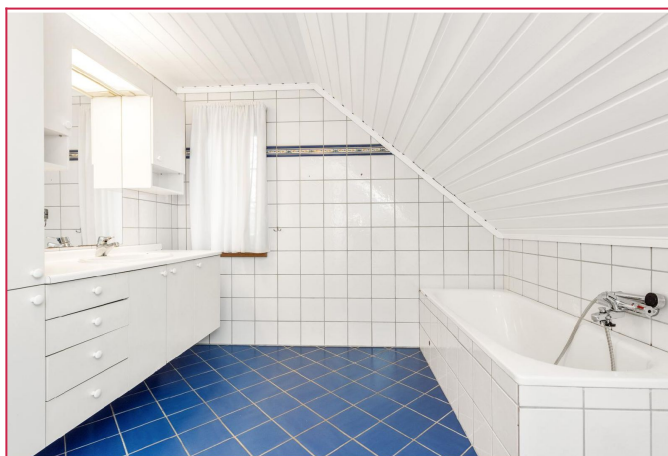
Stort flislagt bad i 2.etg.