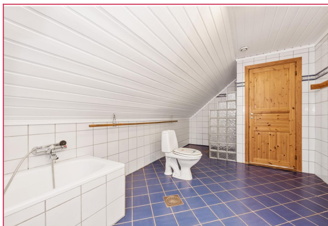
Bad i 2 .etg med dusj og badekar