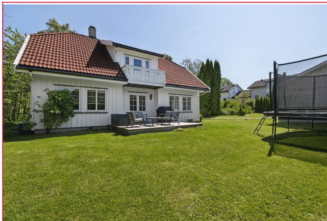
Romslig hage til disposisjon