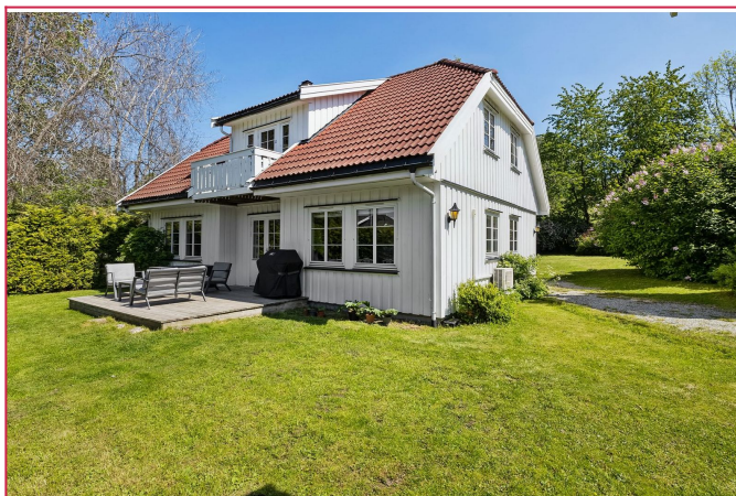
Fasade fra siden med markterrasse