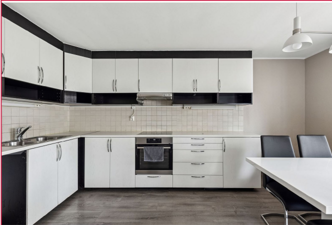
Kjøkken med rikelig med skaplass