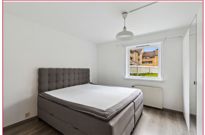
Soverom med godt med skaplass