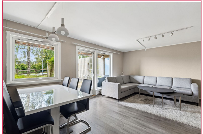
Velkommen til visning