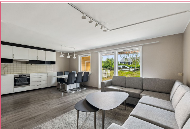
Møbler kan medfølge om ønskelig