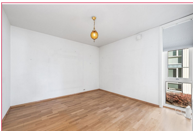
Hovedsoverom med plass til dobbeltseng samt ytterligere møblering.