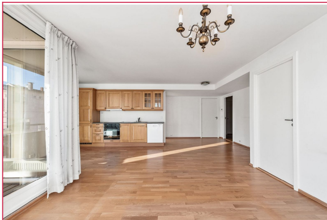
Åpen løsning mellom stue og kjøkken. Rikelig med naturlig lys via store vindusflater.