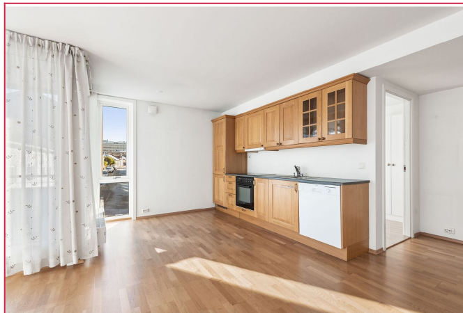
Kjøkken med integrert stekeovn og stekeplate.