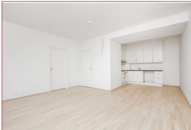
Åpen stue/ kjøkken løsning