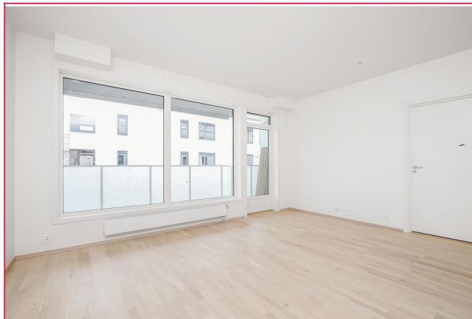
Stue med utang til balkong