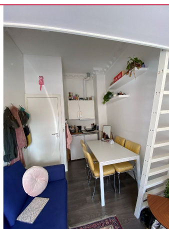
Plass til spisebord - kjøkkenkrok