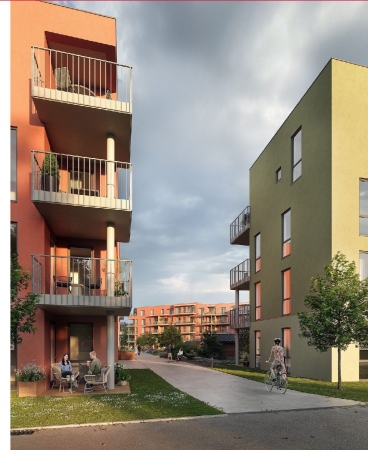
Her får du fjernvarme inkludert i et moderne og nytt bygg.