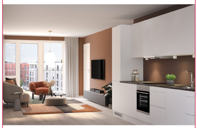
Illustrasjonsbildene er representative for hvordan boligen er i virkeligheten