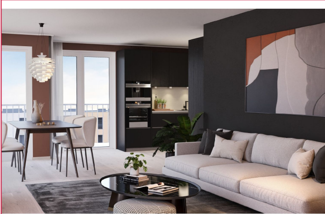
Er du interessert? Ta kontakt for å avtale visning.