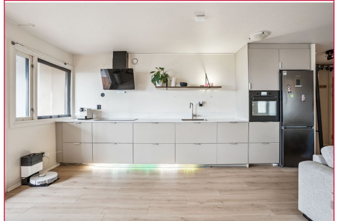
Lekker kjøkken med integretet hvitevarer