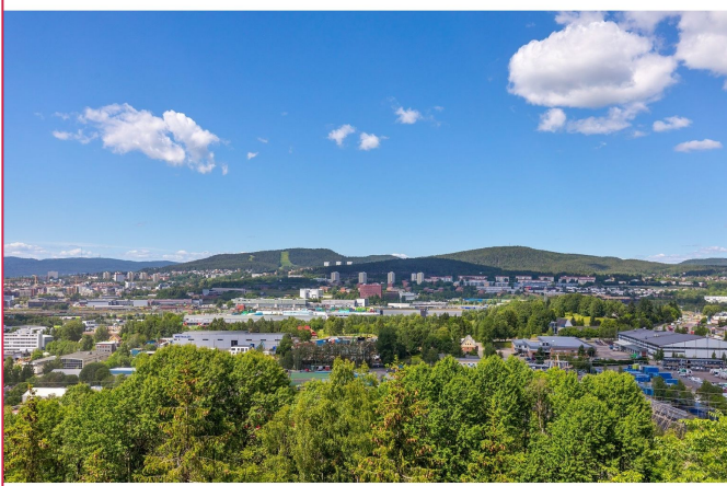
Fantastisk utsikt fra balkongen