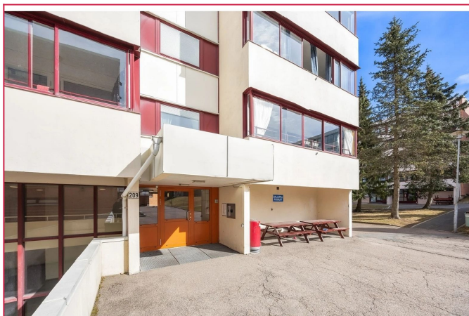
Velkommen til Tvetenveien 209!