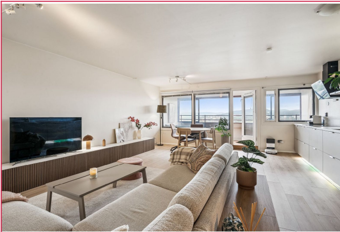
Romslig og innbydende stue med gode møbleringsmuligheter