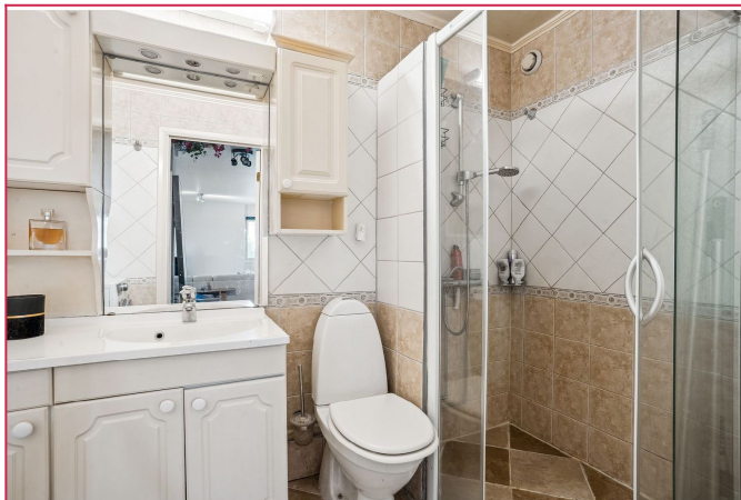
Pent flislgt bad med varmekabler. Vaskemaskin medfølger