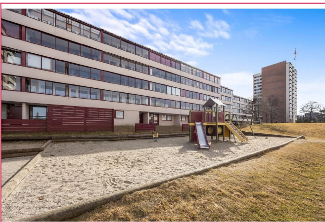
Området er pent opparbeidet med grøntarealer og lekepass