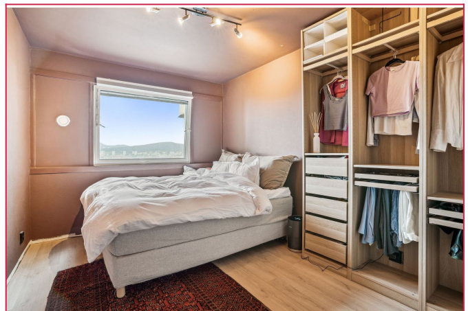
Soverommet fremstår som svært romslig. Her er det god plass til dobbeltseng.