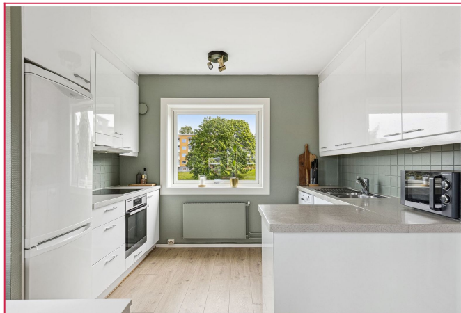
Pent kjøkken med hvite moderne fronter og hvitevarer.