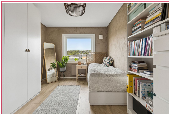
Innbydene soverom med plass til dobbeltseng. Seng medfølger ikke.