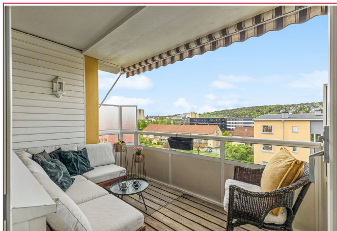
Romslig balkong med utemøbler.