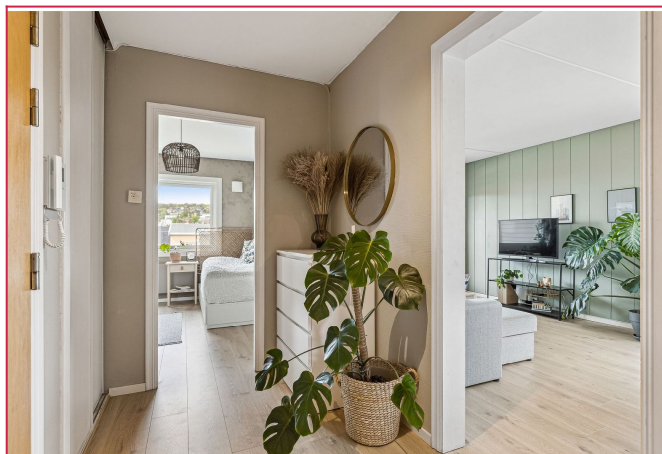
Hyggelig entre med skyvedørsgarderobe og kommode.