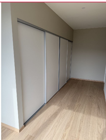
Garderobeskap i gang