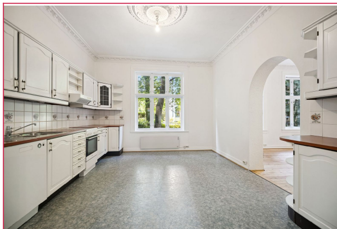
Det er god plass til spisebord for mange