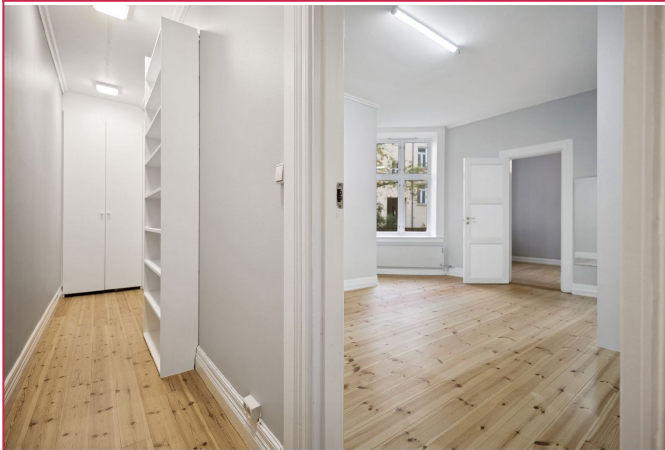
Gang mellom hovedsoverom og bad