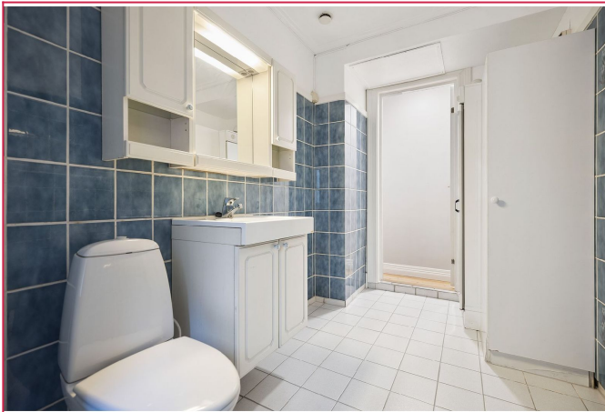
Badet har tørkeskap