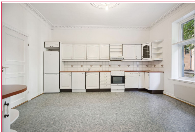
Kjøkkenet leies ut med kombiskap, oppvaskmaskin og stekeovn