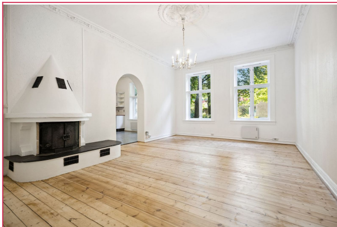
Leiligheten har stor og flott stue med god takhøyde, peis og stukkatur og rosett i tak