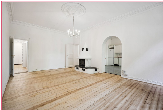
Fra stue er det åpning inn til romslig kjøkken