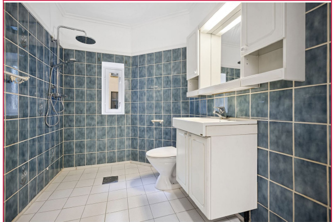
Flislagt bad med varme i gulv - her er det opplegg for vaskemaskin