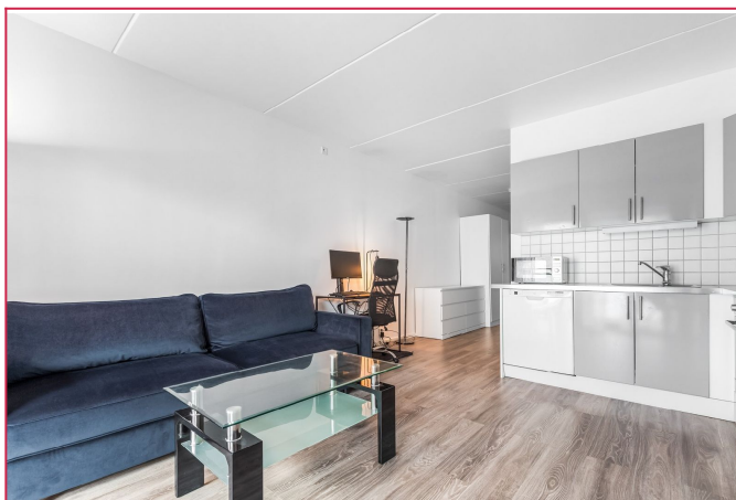
Åpen kjøkkenløsning mot stue.