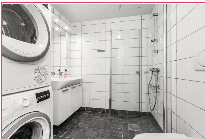
Lyst flislagt bad utsyrt med vaskemaskin.