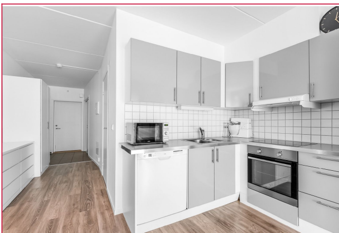
Kjøkkenet er utsyrt med hvitevarer.