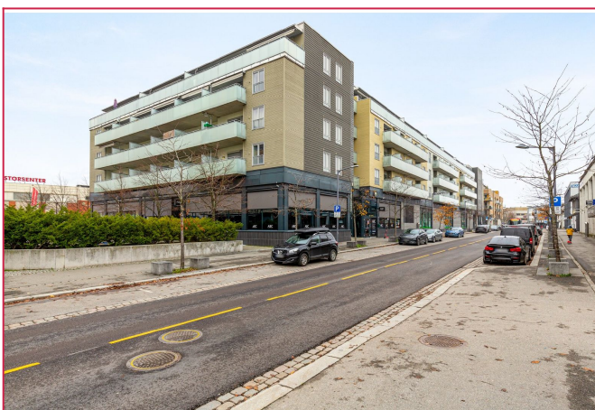
Fasade. Kort vei til Strømmen Storsenter, her finner man en rekke ulike sevicetilbud.