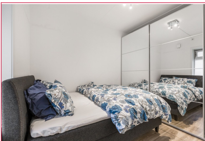
Soverom med god plass til skap.